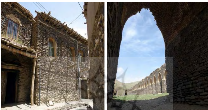
شکل (۲) نمایی از روستای ورکانه

واریزه‌های دامنه‌ای می‌باشد. در شکل (۲ و ۳) تصاویر نمونه‌هایی از این مکان‌ها مشاهده می‌شود.