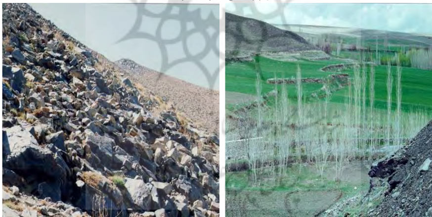
شکل (۴) واریزه‌های دامنه‌ای