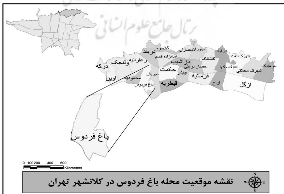
شکل ۲. موقعیت محله باغ فردوس در منطقه یک شهرداری تهران

محله باغ فردوس یکی از محله‌های ناحیه ۷ منطقه یک تهران می‌باشد. زمانی شکل‌گیری این محله می‌توان گفت که این محل محدوده زمانی مشخصی ندارد. ولی این گونه که به نظر می‌رسد زمان شکل‌گیری محله در زمان پادشاهان قاجاریه یا شاید قبل از آن می‌باشد و این محل نیز همانند بسیاری از محلات شمیران به دلیل آب و هوای مساعد و دارا بودن زمین‌های حاصلخیز کشاورزی شکل گرفته است. وجود آثار فرهنگی و تاریخی مهمی همچون باغ موزه هنر ایرانی، موزه سینما، قرائت‌خانه دکتر افشار، عمارت باغ فردوس و غیره بر اهمیت فرهنگی و تاریخی این محله می‌افزاید که این امر نیز مستلزم برنامه‌ریزی و مدیریت صحیح این اماکن به عنوان مکان‌هایی با ارزش که حتی در بحث محیط زیست شهری نیز می‌توانند نقش مهمی ایفاء کنند. باغ