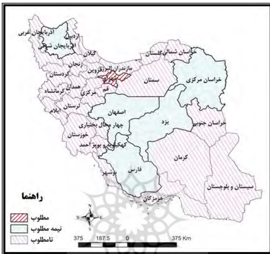
شکل ۷. تعداد واحد مسکونی تعیین شده در پروانه‌های ساختمانی برحسب بخش متقاضی در استان‌ها طی سال‌های ۱۳۸۹ تا زمستان ۹۲

با توجه به آمار ساخت و ساز اتحادیه‌های تعاونی مسکن در مجموع گرایش‌ها به ترتیب استان‌های کرمانشاه ۱۳ اتحادیه، خراسان جنوبی با ۹ اتحادیه و آذربایجان شرقی با ۸ اتحادیه بیش‌ترین تعداد را داشته و اتحادیه استان‌های آذربایجان غربی، بوشهر، چهارمحال و بختیاری، خراسان شمالی، خوزستان، قم، کردستان، کهگیلویه و بویراحمد، گلستان، گیلان، هرمزگان و یزد هیچ‌گونه فعالیت ساخت و ساز ندارند.