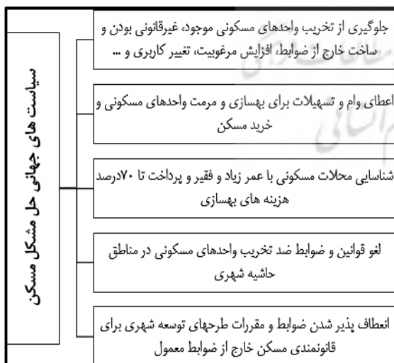
شکل ۳. سیاست‌های جهانی حل مشکل مسکن

در هر یک از این فازبندی‌ها، مسکن شهری با مشکلاتی رو به رو می‌شود و برای بهبود آن راه‌هایی ارائه می‌شود. در نهایت در عرصه سیاست‌های جهانی مواردی به منظور برون‌رفت و حل مشکل مسکن شهری به چشم می‌خورد (شکل ۳).