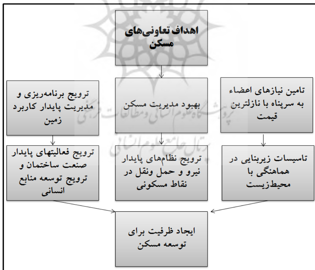
شکل ۱. اهداف تعاونی‌های مسکن

به همین دلیل تعاونی‌های مسکن به عنوان عاملی مطمئن در ساخت‌وساز مسکن اعضاء از آغاز انقلاب شکوهمند اسلامی به