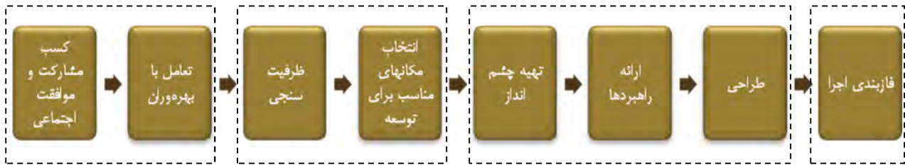
شکل ۱. روند عمومی فرایند برنامه‌ریزی در توسعه میان‌افزا