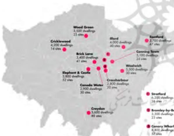
شکل ۳. مراکز شهری با ظرفیت بالای لندن برای مسکن میان‌افزا

شیب: مشخص کردن محدودیت، تا ۱۵ درصد، پتانسیل توسعه را خواهد داشت. (مسکونی کم‌تراکم تا ۵ درصد، مسکونی پرتراکم تا ۱۰ درصد، غیرمسکونی تا ۱۵ درصد).