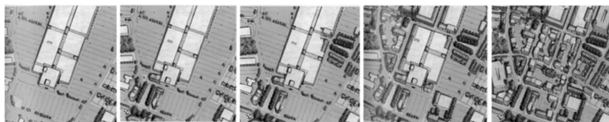
شکل ۴. روند تدریجی بارگذاری توسعه میان افزا