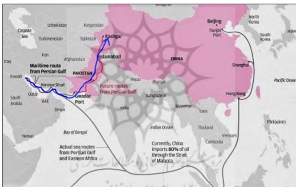
شکل شماره ۱: نقشه مسیر دریایی خلیج فارس به چین و کریدور چین - پاکستان

از نظر رهبران چین، پروژه کریدور چین - پاکستان، یک دروازه اقتصادی است که کمربند اقتصادی جاده ابریشم در شمال را به جاده ابریشم دریایی در جنوب متصل می‌کند و به‌عنوان نوعی تغییر دهنده بازی در معادلات تجاری و ژئواکونومیکی در منطقه ایفای نقش می‌کند. بر این اساس، دو دولت چین و پاکستان در سال ۲۰۱۳ برای فعال‌سازی کریدور اقتصادی چین - پاکستان توافق‌نامه‌ای را امضا کردند که به‌موجب آن پروژه توسعه کریدور چین - پاکستان