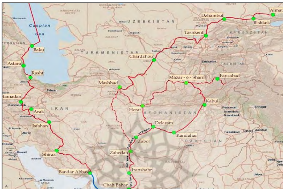
شکل شماره ۳: نقشه کریدور جنوب - شمال از مبدأ چابهار

مشارکت هند در پروژه کریدور جنوبی - شمالی ایران و توسعه بندر چابهار به هند کمک می‌کند تا صادرات خود را به ایران افزایش دهد و در عین حال از هزینه ترابری کالاهای صادراتی خود از طریق این کریدور به آسیای مرکزی، روسیه و اروپای شرقی به میزان ۳۰ تا ۴۰ درصد کاهش دهد. اتصال بندر بمبئی هند به کشورهای CIS از طریق سرزمین ایران برای هر ۱۵ تن کالا حدود ۲۵۰۰ دلار صرفه جویی ارزی نسبت به مسیر اقیانوسی خواهد داشت (Patnaik, 2016). همچنین وارد کردن فرآورده‌های معدنی از کشورهای آسیای مرکزی و افغانستان از این مسیر، دیگر هدف هندی‌ها از سرمایه‌گذاری در چابهار و فعال‌سازی کریدور جنوب - شمال است. در این میان، دولت ایران امیدوار است با تکمیل پروژه کریدور جنوبی - شمالی از مبدأ چابهار درآمدهای ارزی پایداری را برای ایران در پی داشته باشد و علاوه بر ارتقاء جایگاه بین‌المللی ایران، باعث توسعه شرق ایران شود. در مجموع، اهمیت استراتژیک کریدور چابهار به گونه‌ای است که دو منطقه ژئوپلیتیکی و ژئواکونومیکی جنوب آسیا و دو قلمرو سازمان همکاری سارک و شانگهای به قلمرو آسیا مرکزی،