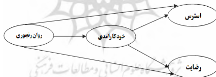
شکل (۱) مدل مفهومی پژوهش

با بررسی ادبیات پژوهش مشخص شد که تاکنون نقش میانجی خودکارآمدی در روابط علی روان‌رنجوری با رضایت و استرس شغلی کارمندان دانشگاه مورد بررسی قرار نگرفته است. لذا رسالت این پژوهش بررسی و تبیین نقش روان‌رنجورخوبی بر رضایت و استرس شغلی با نقش میانجی خودکارآمدی شغلی می‌باشد. در مجموع بر اساس آنچه بیان گردید، الگوی مفهومی و نظری ارتباط بین متغیرهای پژوهش در شکل (۱) آمده است.