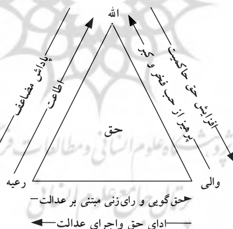
شکل شماره (۱). روابط خدا، مردم و حکومت بر پایه حق دوسویه

در نظر داشتن مفاهیم بالا برای دریافت چگونگی جریان دوسویه حق میان حکومت و مردم و نیز ارتباط آن با حق خداوند، ضروری است. این حق در نخستین سطح خود، میان خداوند و بندگان تعریف شده (گزاره ۴ و ۵) (۳۱) و تا جریان آن میان مردم و حکومت ادامه یافته است. دسویگی حق میان خداوند و بندگان با «اطاعت» بندگان و «پاداش دوچندان» از سوی خداوند، تعریف شده است (گزاره ۵). همین حق، میان حکومت و خداوند در قالب پرهیز از خودستایی و زمامداری برتری جویانه حاکمان، و افزایش حق حاکمیت آنان توسط خداوند مطرح شده است (گزاره‌های ۳۲ و ۳۳). حق دوسویه حکومت و مردم نیز به‌عنوان بزرگ‌ترین حق جعل شده توسط خداوند (گزاره ۷) با اجرای حق و عدالت توسط حاکمیت، و اظهار حق و عرضه عدل به حاکمیت توسط مردم (گزاره ۴۳) توضیح داده شده است (شکل شماره ۱).