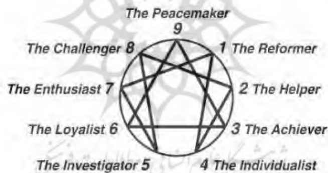
شکل ۲: مدل اناگرام و تیپ‌های آن

هر تیپ شخصیتی با توجه به وجوه سه‌گانه اناگرام در یک گروه قرار می‌گیرد و وجوه سه‌گانه اناگرام عبارت است از: