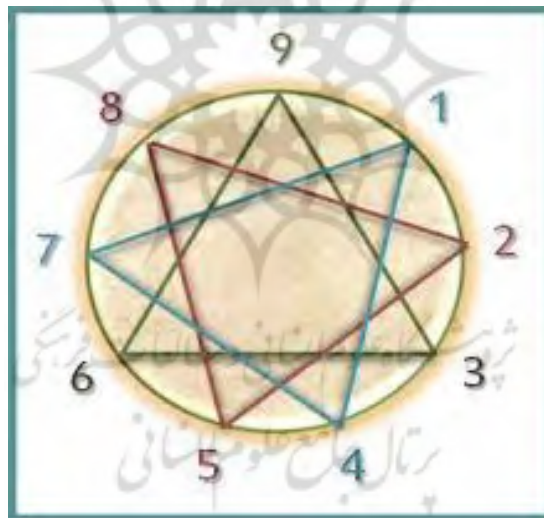
شکل ۱: مدل اناگرام

در این الگو، شخصیت ها به نه تپ طبقه بندی می شوند: