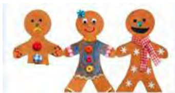
تصویر شماره ۱: دو و نیم!

و نهایتاً مثالی از طنزهای کلامی ارائه شده توسط معلم، بیان حکایت مردی است که به رستوران می رود و در پاسخ به سؤال پیشخدمت که از او می پرسد " پیتزای را به ۴ قسمت تقسیم کند یا ۸ قسمت؟" می گوید " لطفاً ۴ قسمت برش بزنید چون من رژیم دارم!!!"