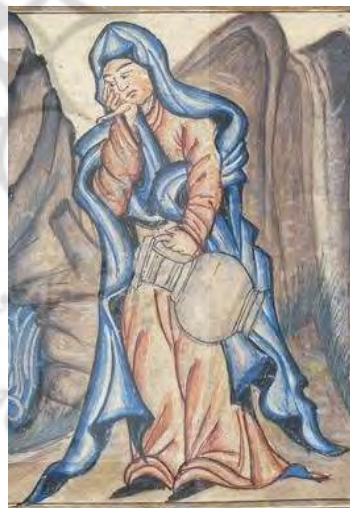
تصویر ۸: چادر، جامع‌التواریخ، نیمه اول سده هشتم ق، برگرفته از (اقبال، ۱۳۸۴: ۴۹).