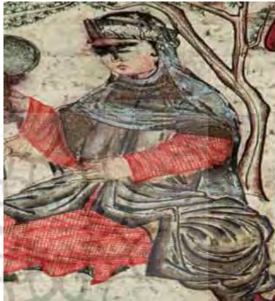
تصویر ۱۱: قمیص و قبا، جامع‌التواریخ، نیمه اول سده هشتم ق، برگرفته از (تجویدی، ۱۳۷۵: ۷۲).

در شعر حافظ کمربندی که بر روی قبا بسته می‌شد قَصَب نامیده شده است: