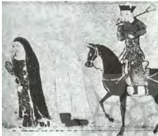
تصویر ۷: چادر، جامع‌التواریخ، نیمه اول سده هشتم ق، برگرفته از (عکاشه، ۱۳۸۰: ۱۱۴).