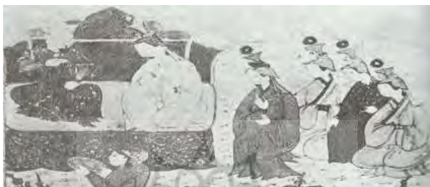
تصویر ۲: بوقناق سربپوش خاتون‌های غازان خان، جامع/تواریخ، نیمه اول سده هشتم ق، برگرفته از (بیانی، ۱۳۸۸: ۱۵۵).

زنان مغول هیچ‌گاه بدون سربپوش خارج نمی‌شدند و حداقل دستمالی بر سر می‌بستند (اشپولر، ۱۳۹۲: ۴۴۳).