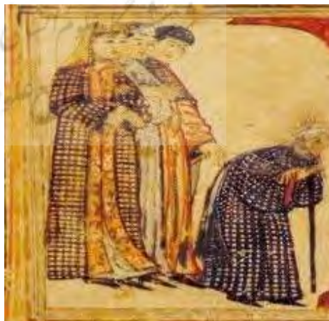
تصویر ۱۳: کفش، جامع‌التواریخ، نیمه اول سده هشتم ق، برگرفته از (عکاشه، ۱۳۸۰: ۱۱۵).

در مکاتبات رشیدی به همراه کفش ذکری از موزه تیماج (منظور کفش ساق‌بلند از پوست بز می‌باشد) برای ساکنان ربع رشیدی به میان آمده است در حالیکه برای مزارعان تنها از کفش نام برده شده است (همدانی، ۱۹۴۵: ۱۹۵). بنابراین موزه پای‌پوش اقشار بالای جامعه بود. ابن بطوطه نیز می‌نویسد که زنان شیرازی موزه به پا می‌کردند (ابن بطوطه، ۱۳۷۰، ج ۱: ۲۵۱). کلمه‌ای که او بکار برده خُف می‌باشد که به معنی نوعی پوتین تا ساق پاست (دزی، ۱۳۸۸: ذیل سَرْمُوز). می‌توان شکل کلی پای‌پوش یک زن را در تصویر ۱۳ از جامع-التواریخ دید. برخلاف مردان که در نگاره‌ها موزه‌های رنگارنگ در پای دارند، پای‌پوش زنان تماماً سیاه رنگ هستند.