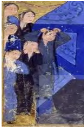
تصویر ۱۰: نوع دیگر تن پوش زنان مغول، جامع‌التواریخ، نیمه اول سده هشتم ق، برگرفته از (همدانی، ۱۳۷۳، ج ۴).

اختلاف در قدرت خرید پوشاک و تهیه آن در بین طبقات مختلف اجتماعی مهم‌ترین عاملی است که پوشاک را به عنوان یکی از نشانه‌های شاخص اختلاف طبقاتی مطرح ساخته است. به همین دلیل ارتباط مستقیمی میان نوع پوشاک و دیگر ویژگی‌های فرد وجود دارد و گاه انتخاب یک نوع خاص از پوشاک اصرار بر نمایش برتری شخص نسبت به عموم مردم است (پاکتچی، ۱۳۸۵، ج ۱۴: ۴۴). دو لباس گران‌بهای طبقات بالای اجتماعی در دوره ایلخانی جامه‌های نخ و نسیج بود (جوینی، بی‌تا، ج ۱: ۱۷۶). جامه نسیج دوخته شده از پارچه‌ای پرپها در روزگار ایلخانان بود که این پارچه از ابریشم و طلا ساخته می‌شد (Kadoi, 2009: 21). ابن بطوطه نخ را جامه حریر مذهب و نسیج را حله‌ای مرصع به جواهر دانسته است (ابن بطوطه، ۱۳۷۰، ج ۱: ۴۰۵ و ۴۲۰). استفاده از این قسم پارچه‌ها در تولید لباس را می‌توان به عنوان میراث زندگی کوچ نشینی به شمار آورد. کوچ نشینان ثروتمند آسیای مرکزی لباس‌هایی رویی خود را با طلا تزئین می‌کردند (Kadoi, 2009: 21).