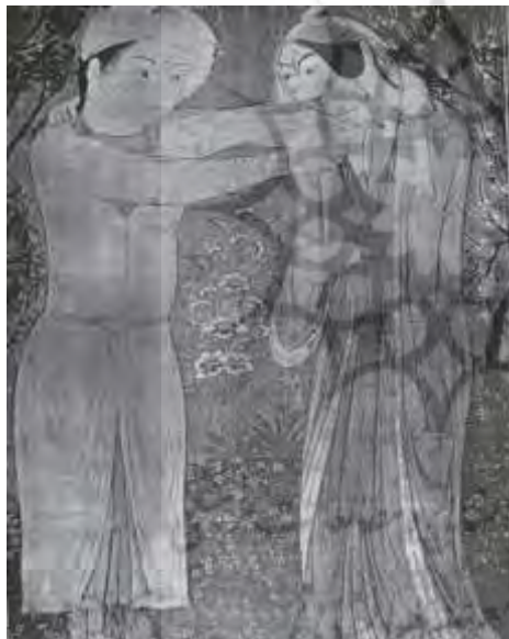
تصویر ۱۲: جبه، نقاشی عاشقان در باغ، اواخر سده هفتم ق، برگرفته از (پوپ، ۱۳۳۸: ۱۷۱).

مختلف، استفاده از دکمه طلا یا جواهر به چشم می‌خورد (علیزاده، ۱۳۸۵، ج ۱۴: ۳۶). بر روی قمیص و قبا نیز جبه پوشیده می‌شد، که با توجه به مرتبه اجتماعی از پارچه کرباس کم بها تا اطلس گرانبها تهیه می‌شد (همدانی، ۱۹۴۵: ۱۹۵). جبه تن‌پوشی زمستانی بود که حتی «عورات درویش حال» نیز به واسطه صدقات از آن برخوردار می‌شدند (هروی، ۱۳۵۲: ۴۴۱). این پوشش در تصویر ۱۲ قابل مشاهده است.