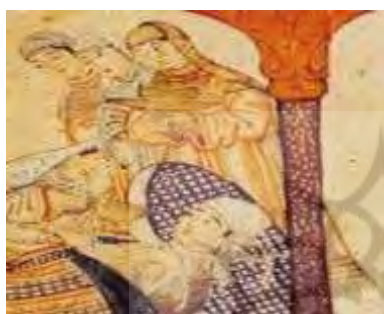
تصویر ۶: مقنعه، جامع التواریخ، نیمه اول سده هشتم ق، برگرفته از (همدانی، ۱۳۷۳، ج ۴).

شده پوشیده...» (ابن بطوطه، ۱۳۷۰، ج ۱: ۴۰۵). این نوع از مقنعه را در تصویر شماره ۶ از جامع التواریخ بر سر زنانی که در مقابل غازان خان ایستاده‌اند می‌توان مشاهده نمود.