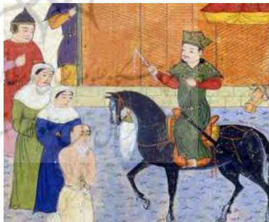
تصویر ۵: مقنعه، جامع التواریخ، نیمه اول سده هشتم ق، برگرفته از (عکاشه، ۱۳۸۰: ۱۱۵).

نمونه دیگر مقنعه در نگاره‌ها، از دو قسمت تشکیل شده؛ تکه روی سر این نوع پوشش یا کوتاه است یا تا پشت زانو امتداد می‌یابد. این سرپوش در نقاشی‌هایی که از داستان‌های پیامبران ترسیم شده است بر سر زنان دیده می‌شود و در تصویر شماره ۵ از جامع التواریخ که ولادت حضرت محمد (ص) را نشان می‌دهد قابل مشاهده است.