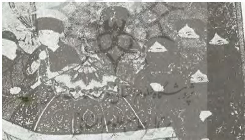
تصویر ۱۷: پوشش عزاداری زنان در مرگ غازان خان، جامع‌التواریخ، نیمه اول سده هشتم ق، برگرفته از (بیانی، ۱۳۸۸: ۱۵۶).

احتمالاً زنان مغول در ایران بعد از گروش به اسلام به نوعی از فرهنگ پوشش اسلامی متأثر شده‌اند اما به ندرت در نگاره‌ها چنین تأثیری قابل ردیابی است. به طور بارز و مشخص در یک مورد از نگاره‌ها تأثیر فرهنگ اسلامی در پوشش زنان مغول به چشم می‌خورد. در نگاره شماره ۱۷ از جامع‌التواریخ که نشانگر مرگ غازان خان است، چهار همسر او در پشت تابوت ایلخان ایستاده‌اند و روبنده بر صورت بسته‌اند، در حالیکه در تصویر ۲ این زنان در کنار غازان بوقناق بر سر نهاده‌اند. استفاده از روبنده از تأثیرات پوشاک ایرانی-اسلامی است چراکه در نگاره شماره ۱۸ برگرفته از جامع‌التواریخ که مرگ هلاکوخان را نشان می‌دهد، هیچ زنی روبنده‌ای بر صورت ندارد.