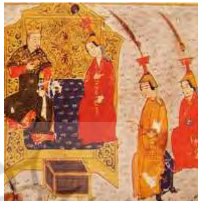
تصویر ۱: بوقتاق، جامع‌التواریخ، نیمه اول سده هشتم ق، برگرفته از (همدانی، ۱۳۷۳، ج ۴).

بوقتاق در فرهنگ مغول جایگاهی خاص و کاربردهایی ویژه داشت. این سرپوش ملکه به شمار می‌رفت و در روز تاج‌گذاری بر سر اولین همسر خان نهاده می‌شد: «...روز یکشنبه بیست و ششم (ذی القعدة سال ۷۰۴ ق) بر سر قتلغشاه خاتون دختر امیر ایرنجین بوغتاق نهادند...» (قاشانی، ۱۳۴۸: ۴۴). استفاده دیگر این سرپوش در زمانی بود که یک قوما - زن غیر رسمی - بنابر شرایطی در ردیف خاتون‌ها قرار می‌گرفت و ارتقاء مقام می‌یافت. چنانچه در جامع‌التواریخ آمده است: «... اباقخان توقیتی خاتون را که قومای هلاکوخان بود با خود گرفت و بجای توقوز خاتون بوغتاق بر سر نهاد و خاتون شد.» (همدانی، ۱۳۷۳، ج ۲: ۱۰۵۵) یا «...مادر او قومایی بوده... و بعد از مدتی بوغتاق بر سر نهاده...» (همدانی، ۱۳۷۳، ج ۲: ۹۶۸).