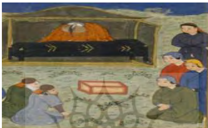
تصویر ۱۸: پوشش عزاداری زنان در مرگ هلاکوخان، جامع/التواریخ، نیمه اول سده هشتم ق، برگرفته از (همدانی، ۱۳۷۳، ج ۴).

به نظر می‌رسد زنان ایرانی به دلیل حفظ حجاب اسلامی در خصوص پوشش‌های سر از سرپوش‌های مغولی الهام نگرفته‌اند و شواهدی که از منابع مکتوب و نیز مشاهداتی که از نگاره‌ها حاصل گشته و پیشتر بدان اشاره شد نشان می‌دهد که اغلب زنان ایرانی راعی حجاب بوده‌اند. اما در خصوص تن‌پوش‌ها لباس زنان ایرانی از دو نظر از لباس‌های زنان مغول که آن هم تحت تأثیر الگوهای چینی بود متأثر شده است. قبا‌های زنان در پیش از دوران ایلخانان تماماً آستین‌هایی تنگ داشتند که در محل مچ دست کاملاً چسبان بود و در نگاره‌ها به ندرت قباهایی که آستین آن در محل مچ دست گشاد باشد مشاهده می‌شود (چیت ساز، ۱۳۷۹: ۲۸۴). در حالیکه احتمالاً تحت تأثیر الگوهای لباس‌های چینی که لباس زنان مغول در ایران را شکل داده بود، لباس زنان ایرانی در دوره ایلخانی به قباهایی با آستین‌های گشاد - تصاویر ۵، ۷ و ۱۱- یا بسیار گشاد - تصاویر ۴، ۶، ۱۳ و ۱۴- مبدل شده است. همان‌گونه که در نگاره‌های برجای مانده از زنان درباری مغول - تصاویر ۱، ۲، ۹ و ۱۸- هم لباس رویی زنان آستین‌هایی بسیار گشاد دارد.