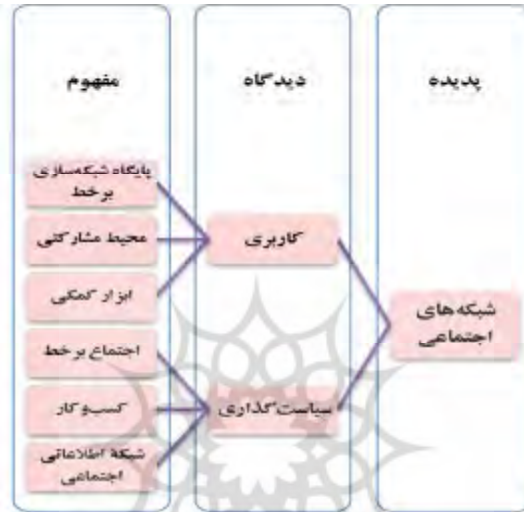
شکل 2. شش مفهوم شبکه‌های اجتماعی از دیدگاه کاربری و سیاست‌گذاری

دسته‌بندی مفهوم محور عوامل مؤثر بر موفقیت شبکه‌های اجتماعی (جدول 3) نتیجه نگاه به آنها در راستای داشتن تجربه موفق کاربری و تجربه موفق سیاست‌گذاری در این شبکه‌هاست. این دسته‌بندی، هر یک از دیدگاه‌های کاربری و سیاست‌گذاری را در سه مفهوم خلاصه می‌کند که عبارت‌اند از (شکل 2):