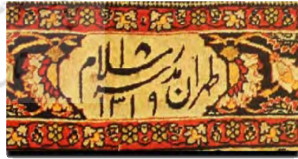
تصویر ۱-ج. کتیبهٔ