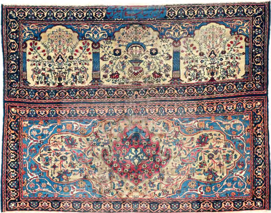
تصویر ۲-الف. قالیچهٔ تهران، طرح محرابی-ترنجی، تار و پود نخ و پرز پشمی، گرهٔ نامتقارن، حدود