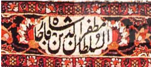
تصویر ۱-ب. کتیبهٔ

پیش از دوران قاجار در ایران مفهوم مدرسه به شیوهٔ جدید آن شناخته نبود. مکتب‌خانه‌ها و مکتب‌دارها امر آموزش را پیش می‌بردند. درس‌های مکتب‌خانه معمولاً شامل خواندن و نوشتن سادهٔ فارسی و تعلیم قرآن و برخی آثار ادبیات کلاسیک فارسی بود و ماهیت آموزشی مکتب از فن و حرفه و صنعت فاصله داشت. بنابراین شاگرد در صورت فارغ شدن از درس، برای یادگیری یک حرفه باید نزد استادان مشاغل می‌رفت. امیرکبیر در زمان ناصرالدین شاه با بنیان گذاشتن دارالفنون در صدد کاربردی کردن آموزش برآمد، اما این مدرسه در اساس خود برای قشری خاص و تحصیلکرده در نظر گرفته شده بود و سطح آن فراتر از مدارس ابتدایی و گاه حتی متوسطه بود. تا قبل از حکومت مظفرالدین شاه فراگیری یک مهارت در مدرسهٔ ابتدایی هیچ‌گاه در کنار علوم نظری قرار نگرفت، هرچند در همین دوره نیز از حوزهٔ چند مدرسه خارج نمی‌شود. در موزهٔ فرش ایران دو قالیچهٔ کتیبه‌دار وجود دارد که از نظر نقش و نگاره‌ها و رنگ‌پردازی کاملاً مشابه و جفت یکدیگرند و بر بالای آنها نام «السلطان مظفرالدین شاه قاجار» و در پایین عبارت «طهران مدرسهٔ اسلام ۱۳۱۹» بافته شده است و طرح افشان همراه با نقوش گرفت‌وگیر ۱ دارند (تصاویر ۱-الف، ۱-ب و ۱-ج).