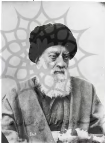
تصویر ۳. سید محمد طباطبایی

خود را از قافلهٔ آزاداندیشی عقب می‌پنداشت و همچنان که گذشت، تأسیس مدرسه به مفهوم حضور و فعالیت این افراد در سیاست و تحولات جامعه بود. سید محمد طباطبایی (۱۲۵۸-۱۳۳۹ ق.) از شاخص‌ترین افرادی بود که در این فضا به آموزش نوین روی آورد (تصویر ۳). در آزادی‌خواهی و بزرگ‌منشی طباطبایی شکی نیست. وی خواهان تأسیس مجلس و عدالت‌خانه بود و گونه‌ای سلطنت مشروطه و عرفی و دنیایی را مورد تأیید قرار می‌داد. ۱ او به خوبی می‌دانست تشکیل یک مجلس و یک عدالت‌خانه سبب می‌شود که امتیازهای روحانی‌اش را از دست بدهد، اما درگیر انگیزه‌ها و سودهای صرفاً فردی و مادی نبود. ۲ در نامه‌هایش به مظفرالدین‌شاه و عین‌الدوله صدقاتی به چشم می‌خورد که بیانگر نحوهٔ تفکر اوست. ۳