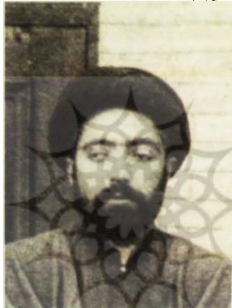
تصویر ۶. سید محمد صادق طباطبایی

طرف دولت گرفته به حال خود باقی می ماند. ۱ به هر روی طباطبایی نظام نامه انجمن معارف را نمی پذیرد. مفاد این نظام نامه هر چه بوده است، احتمالاً از نظر طباطبایی استقلال مدرسه را دستخوش تزلزل می ساخته است و او نمی توانسته آنگونه که می پسندیده است مدرسه را پیش ببرد. در نتیجه این کشمکش، از حدود ۱۳۲۰ ق. با قطع شدن یا حداقل کم شدن کمک دولت، برای پوشش برخی هزینه ها تکیه بر صنایع مدرسه و به ویژه قالی بافی که در آن زمان شهرتی به هم رسانیده بود، بیشتر م شد. ۲