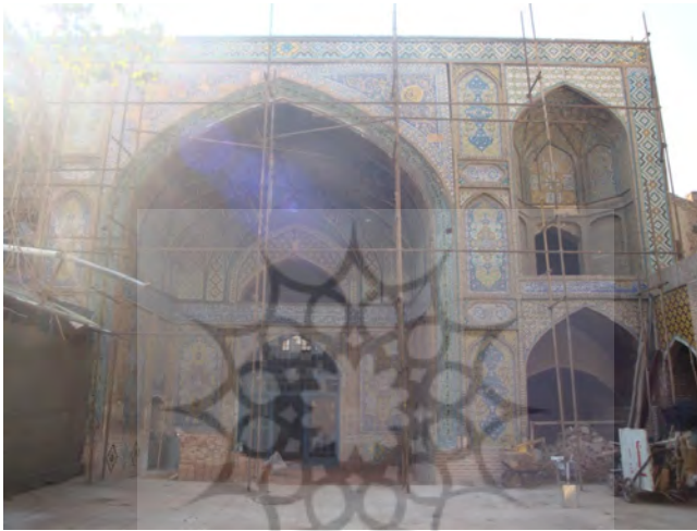
تصویر ۹. نمایی از ایوان مدرسه حاجی رجبعلی، ۱۳۹۳ ش. تصویر از نگارندگان.

حمایت را در پیشرفت مدرسه داشته است. ۱ مدرسه حاجی رجبعلی به وسیله صاحبش در اوایل سلطنت ناصرالدین شاه وقف مسجد شد و هم اکنون این بنا در محله درب خوانقاه باقی مانده است (تصویر ۹)، اما دیگر اثری از عمارت مسکونی صدیق الممالک نیست.