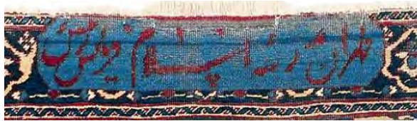
تصویر ۲-ب. کتیبهٔ «طهران مدرسهٔ اسلام فرمایش حسن؟» در قالیچهٔ تصویر ۲-الف.

این مقاله با مطالعه در اسناد و نوشته‌های عصر قاجار به اسباب و چگونگی توجه به هنر قالی‌بافی در مدرسهٔ اسلام پرداخته است. تاریخ این مدرسه با سیاست، اوج و افول مشروطیت، اخلاق، و به عبارت دقیق‌تر ظهور آموزش نوین در هم پیچیده است، بنابراین ضروری است