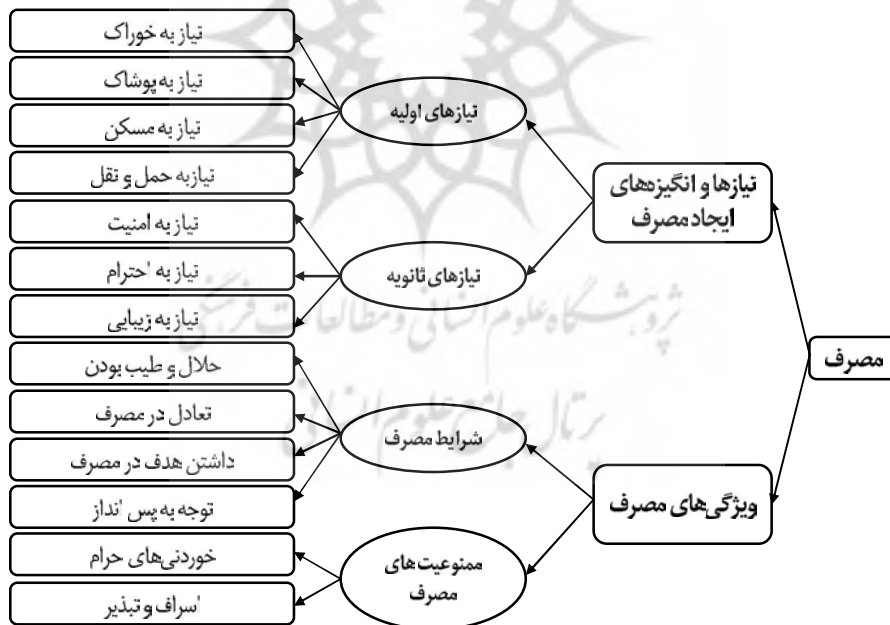
نمودار ۴: مؤلفه‌های تربیت اقتصادی در ذیل مفهوم مصرف بر اساس آموزه‌های اسلامی (تگابندگان)

مؤلفه‌های تربیت اقتصادی در حوزه مصرف، مؤلفه‌هایی هستند که انسان را به مصرف بهینه سوق داده، او را از افراط و تفریط بازمی‌دارد. برای دستیابی به تربیت اقتصادی مطلوب در این حوزه می‌توان برنامه‌های درسی را بر اساس این محتوا متناسب یا سطح درک و انتزاع دانش‌آموزان تدوین کرد. مؤلفه‌های شناسایی شده در حوزه مصرف بر اساس یافته‌های پژوهش، به اجمال در نمودار شماره ۴ ارائه شده است.