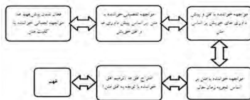
شکل ۱: مراحل فهم از دیدگاه گادامر