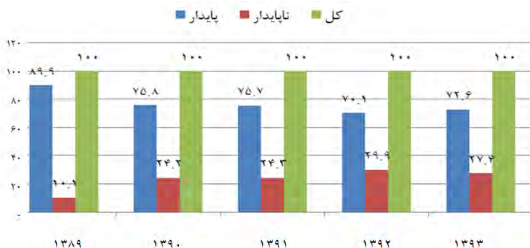
نمودار (۱). وضعیت پایداری درآمدهای شهرداری ایلام طی دوره پنج‌ساله (به درصد)