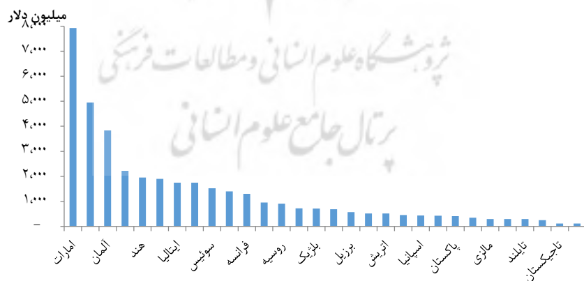
نمودار (۱) - طبقه‌بندی شرکای تجاری ایران طی دوره ۲۰۱۴ - ۱۹۹۲

در نمودار (۱) وضعیت ۳۰ شریک اول تجاری ایران بر اساس میانگین حجم تجارت تحقق یافته با ایران طی ۲۳ سال، طبقه‌بندی شده‌اند. واضح است که تعدادی از این کشورها جزء همسایگان ایران هستند و تعدادی نیز دارای فواصل بسیار طولانی با ایران هستند و به صورت میانگین، حجم عظیمی از تجارت با آنها صورت گرفته است. همچنین وضعیت این کشورها به همراه پاره‌ای از خصوصیات اقتصادی و جغرافیایی آنها که در تخمین الگوی پژوهش موثر است در قالب جدول (۶) در پیوست ارائه شده است.