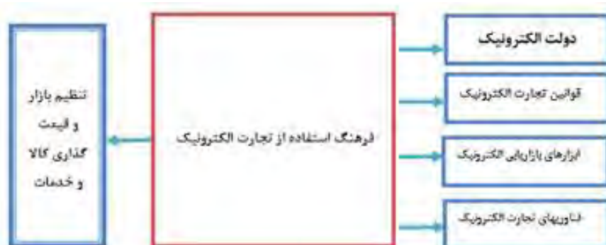
شکل ۲: مدل مفهومی پژوهش