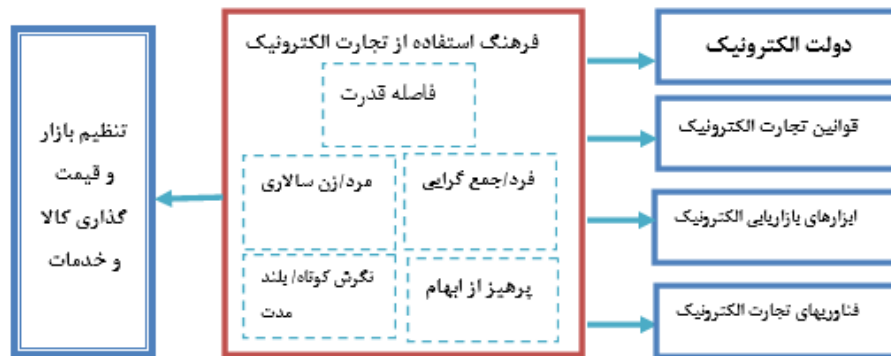
شکل ۳: مدل توسعه یافته پژوهش بر اساس نظریه هافستد

احساسی و عاطفی از گروه‌ها، سازمان‌ها و دیگر شکل‌های گروهی مستقل باقی می‌مانند. در کشورهای جمع‌گرا، از جمله مکزیک، افراد برای تبادل وفاداری، تأکید بر تعلق داشتن و تصمیم‌گیری گروهی یکدیگر را جست‌وجو می‌کنند (فرانسکو و گلد، ۲۰۰۵). تحقیقات پیشین، در ایران نشان‌دهنده وجود روحیه جمع‌گرایی در بین استفاده‌کنندگان تجارت الکترونیک است (کفاش‌پور، ۱۳۸۹). پژوهش حاضر تأییدکننده نتایج به‌دست‌آمده در این زمینه است. این امر، در مبحث شبکه‌های اجتماعی به‌وضوح مشاهده می‌شود. ابزارهای بازاریابی و فناوری به‌شدت در حال کاهیدن این فاصله هستند و حتی فردگراترین افراد را در محیط‌های مجازی و شبکه‌های اجتماعی تحت تأثیر قرار می‌دهند. از این طریق، طیف وسیعی از جامعه را که به دلیل فردگرایی در اجتماعات حضور پیدا نمی‌کنند به کار می‌گیرند. همچنین حس وفاداری و تعلق به گروه را در آنان ایجاد می‌کنند. در پژوهش حاضر، پاسخگویان ارتباط با مشتری را در شبکه‌های اجتماعی موجب رونق فروش خود دانسته‌اند.