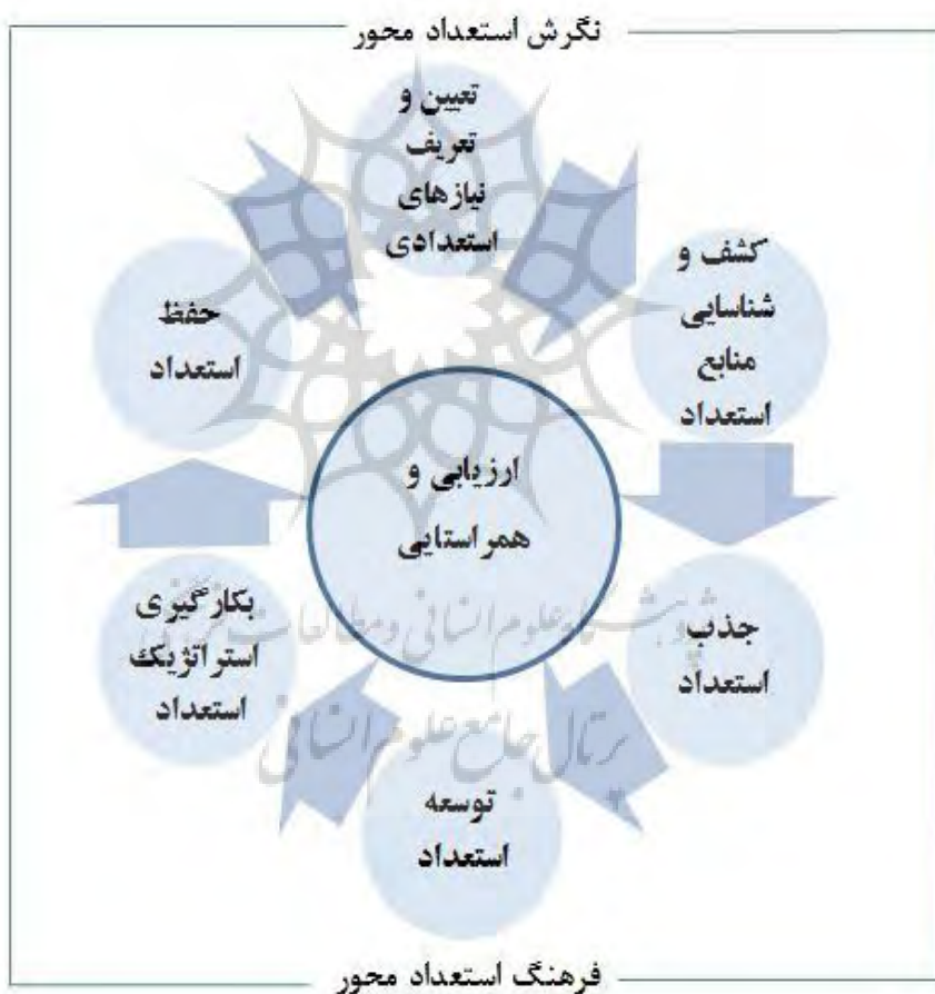
شکل ۲: مدل پیشنهادی فرایند مدیریت استعداد در دانشگاه‌های استعداد محور

در این مطالعه سعی شده است به همه ابعاد فرایند مدیریت استعداد اعضای هیات علمی به عنوان کلیدی‌ترین پست در دانشگاه‌ها توجه شود. با توجه به آنچه که در جریان پژوهش تشریح گردید، شکل ۲ مدل پیشنهادی فرایند مدیریت استعداد اعضای هیات علمی را در دانشگاه‌های استعداد محور نشان می‌دهد.