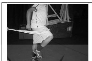
دست و پای مخالف (راه رفتن)