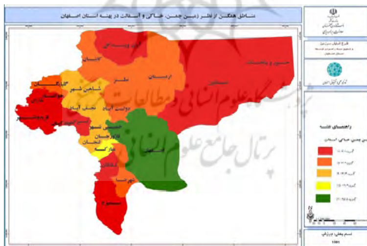
نقشه ۳. مناطق همگن از نظر سرانه ورزش های چمنی و خاکی در پهنه استان

براساس اطلاعات شکل ۲ در سرانه ورزشی اماکن سالن های اختصاصی شهرستان های خوانسار و نائین بالاترین سرانه را در بین شهرستان های استان به خود اختصاص داده اند. ضمن اینکه شهرستان اصفهان در سرانه سالن های اختصاصی نیز در وضعیت ضعیف قرار دارد.