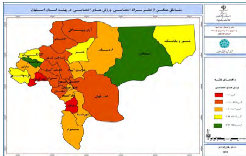
نقشه ۲. مناطق همگن از نظر سرانه ورزش های سالن های اختصاصی در پهنه استان

براساس اطلاعات شکل ۲ در سرانه ورزشی اماکن سالن های اختصاصی شهرستان های خوانسار و نائین بالاترین سرانه را در بین شهرستان های استان به خود اختصاص داده اند. ضمن اینکه شهرستان اصفهان در سرانه سالن های اختصاصی نیز در وضعیت ضعیف قرار دارد.