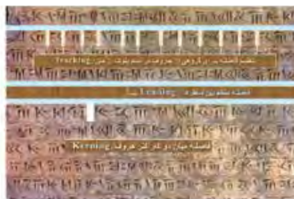
تصویر ۷- رعایت اصول فاصله کرنینگ، لدینگ و تراکینگ.

می‌شود. فرم نوشتار بر روی مخاطب ایجاد عظمت نمایی می‌کند که می‌تواند جلوه‌گر شکوه و بلوغ فرهنگ و هنر ایران باستان باشد. (تصویر ۸)