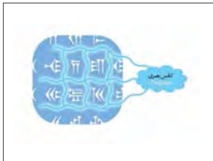
تصویر ۶- تنفس بصری (پاساژ) در فضای منفی خط میخی پارسی باستان.

بلوک از متن و یا میانگین فاصله شخصیت‌ها در یک خط کرسی است. در کتیبه‌ی خط میخی هخامنشی این میانگین به خوبی در نظر گرفته شده و چشم در مسیر خوانش حروف با سرعت مشخصی حرکت می‌کند. کرنینگ ۸ فرایند تنظیم فاصله میان شخصیت‌ها و یا تنظیم فاصله میان فرم حروف است درحالی‌که تراکینگ تنظیم فاصله یکنواخت میان یک بلوک مشخص از حروف است. فاصله ایجاد حریم می‌کند و فواصل می‌تواند در مسیرهای گوناگونی وجود داشته باشند. ایجاد این حریم میان تمامی شخصیت‌ها امری مهم به شمار می‌رود و اگر فاصله میان چند شخصیت بی‌دلیل به هم بچسبد موجب برخورد بصری گردیده و چشم در آن نقطه تمرکز بیش‌ازحدی پیدا می‌کند و این مسئله‌ای جالب‌توجه است که در خوانایی نوشتار اغلب از معایب به شمار می‌رود. فضای میان حروف در خط میخی به‌طور یکسان پراکنده شده و در اصطلاح کرنینگ منظمی دارند و هماهنگی خوبی میان شخصیت‌ها برقرار است. مسیر جهت خط‌ها در لاین‌های عمودی، افقی و مورب است. لیدینگ ۹ (فاصله‌ی منظم بین سطرها) هماهنگ است. سطرهای حروف میخی بافاصله منظمی از هم جدا شده‌اند و در مسیرهای مشخصی حرکت می‌کنند. میان دو یا یک سطر یک بلوک خالی از حروف وجود دارد که نمونه این ساختارگرایی در فرم‌بندی تایپ سری و امروزه در فرم‌بندی دیجیتالی با نرم‌افزارهای مدرن مشاهده می‌شود. (تصویر ۷) ارزش خطی استروک ۱۰ و کنتراست بصری آن در خط میخی بسیار زیاد است. جنس این خط تحت تأثیر از ابزار به‌کاررفته برای اثرگذاری است. صورت فرم میخی شکل خط، سه‌کنج تیز را تداعی می‌کند که باعث ایجاد فضایی بیانگر در مشاهدات بصری می‌شود. نحوه قرارگیری و