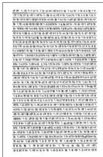
تصویر ۳- متن کتیبه «داریوش بزرگ» در نقش رستم. منبع: https://irpedia.wordpress.com

تصویر ۵- جرز غربی ایوان جنوبی کاخ داریوش در تخت جمشید با کتیبه‌ای از خشایارشا به پارسی باستان، ایلامی و اکدی. مأخذ: (کرتیس و تالیس، ۱۳۹۲: ۴۱)