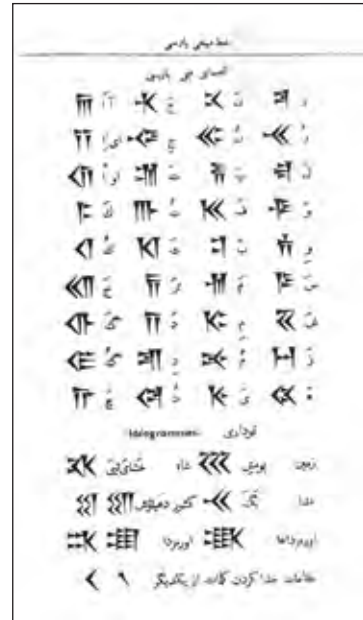
تصویر ۱- الفبای خط میخی پارسی. مأخذ: (فضائلی، ۱۳۹۰: ۴۷):

به کار می‌رفته تلفظ لغات را به درستی نشان نمی‌دادند. اختراع کنندگان الفبای فارسی باستان قواعدی برای دلالت نشانه‌های میخی شکل، بر واج‌های فارسی باستان وضع کرده بودند (ابوالقاسمی، ۱۳۸۹: ۳۱).