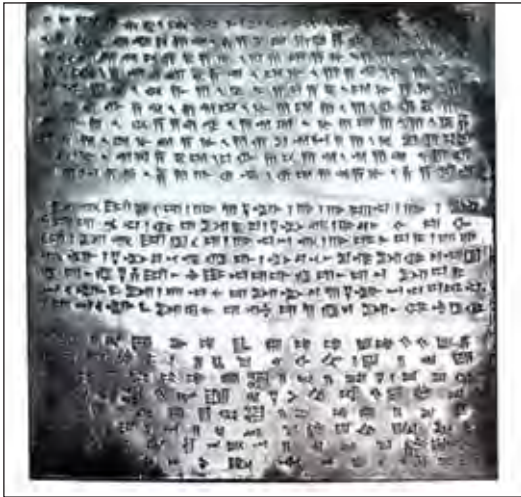
تصویر ۲- کتیبه طلائی و نقره‌ای که زیر پایه‌های کاخ آپادانای تخت جمشید کشف شد.