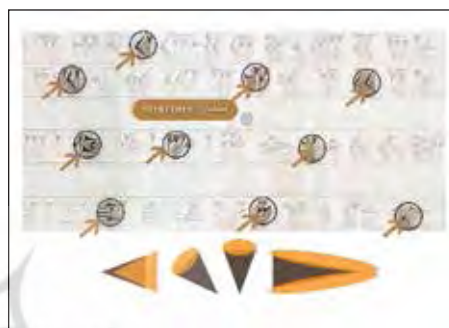
تصویر ۸- ساختار خط میخی پارسی باستان.

بافت آن عنصر بصری است که بسیاری از اوقات به‌عنوان بدل برای ارضای یکی از حواس که همان حس لامسه باشد، ایجاد می‌شود؛ اما در حقیقت، ما می‌توانیم بافت یک پدیده را با دیدن تنها یا لمس کردن تنها با تلفیق این دو بازشناسیم و ارزش آن را دریابیم. ممکن است بافتی فقط کیفیت بصری داشته باشد و فاقد کیفیت ملموس باشد؛ مانند بافت بصری حاصل از چیده شدن حروف و کلمات در کنار یکدیگر. بسیاری از دریافت‌های حسی ما از بافت به‌صورت بصری است (داندیس، ۱۳۸۷: ۸۸) بافت خط از چینش و تلفیق عناصر بصری خط میخی شکل با یکدیگر پدید می‌آید. بافت‌ها می‌توانند نرم، صاف و یا زبر باشند. امروزه مدرن‌ترین رویکرد تایپوگرافی استفاده از ضخامت کم در تایپ برای بیان محتوا است که موجب بالا بردن عمق نفوذ محتوا و بیان ساده و صریح کلمات می‌شود. (تصویر ۹)