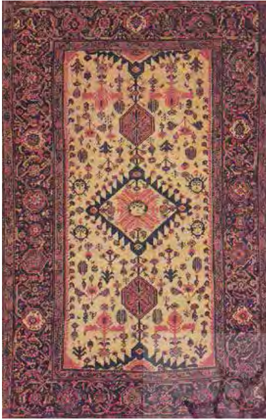
تصویر ۳- نقش خورشید خانم در ترنج فرش، فراهان، ربع پایانی دوره قاجار، ۱۳۷×۲۱۱ (ژوله، ۱۳۹۰، ۳۵۴)

چنان‌که پیش‌تر بدان اشاره‌شده است، در پس ظاهر پرپیچ‌وتاب نقوش قالی ایرانی، معانی و مفاهیم گسترده‌ای نهفته است و هر یک از قالی‌های ایرانی خواه عشایری، روستایی و یا شهری بیانگر حقیقتی نمادین است که به خارج از عالم ظاهر اشاره دارد (دانشگر، ۱۳۸۸: ۸۳). این نمادینگی در قالی ایرانی از ذهن هنرمندی نشئت می‌گیرد که ناخودآگاه به نمادین کردن یک ایده آل هنری می‌پردازد و به هر میزان که این اثر هنری از طبیعت فاصله می‌گیرد، ایده آل وی که عموماً از قواعد و دستورات آیینی و فرهنگی تبعیت می‌کند، بیشتر متجلی می‌شود (تجدد، ۱۳۹۰: ۶۵). بدین سبب می‌توان گفت قالی ایرانی اثری است که به‌واسطه تلاش هنرمند طراح و یا بافنده، مفاهیم و معانی کثیری را ورای این جهان خاکی به نمایش می‌گذارد.