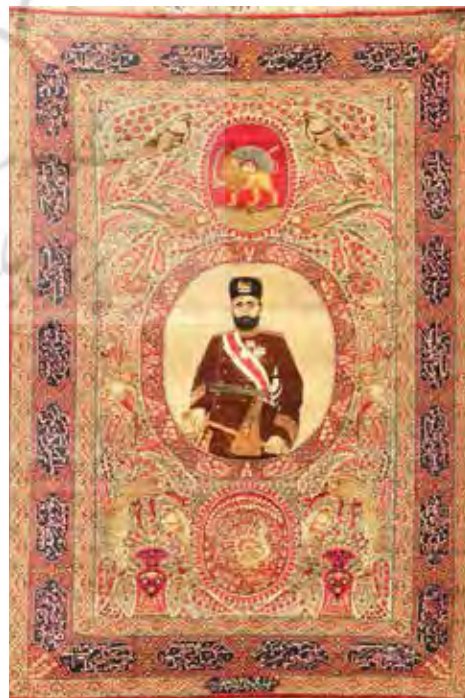
تصویر ۱۳- قالی شجاع نظام، نقش شیر و خورشید خانم، بافت راور، ۱۲۶۲ ه. ش، ۲۲۴×۱۴۴

جایگاه این نگاره در قالی‌های مرسوم و دارای نقش مایه‌های گیاهی عموماً در میان قالی و در نقاطی همانند ترنج، لچک و یا متن و نه در حاشیه به شکلی شکسته و یا منحنی مشاهده می‌شود. از این رو تداعی مفاهیم ویژه‌ای را بنا بر نوع جایگاه به همراه دارد. حضور نگاره مورد بحث در ترنج قالی با تشدید و تأکید بر آن، در لچک حضور خالق و یا نیرویی ماورایی و قدسی در پس حجاب و در متن قالی بنا بر نوع طرح، با مفاهیم متنوعی همراه است. همچنین