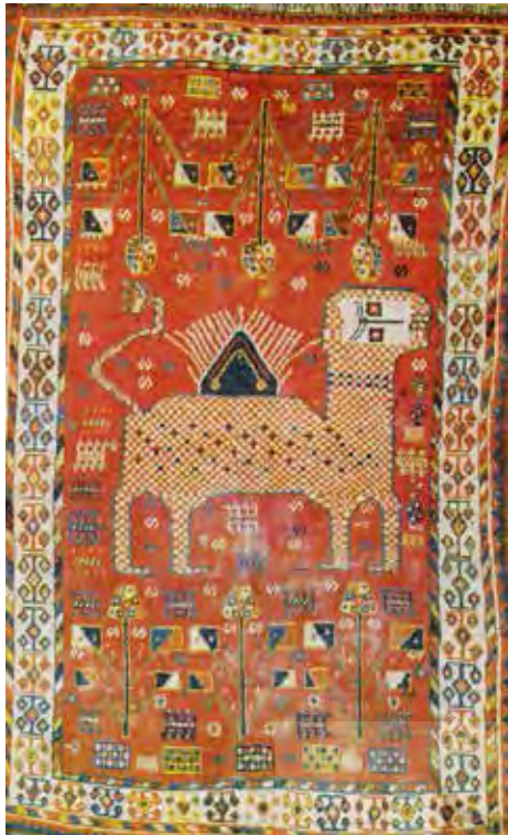
تصویر ۱۲- فرش قشقایی (کشکولی)، نقش شیر و خورشید خانوم، محل بافت فارس، در فرش فارس، ۱۱۵×۱۸۸ (تناولی ب، ۱۳۵۶: ۱۱۴)