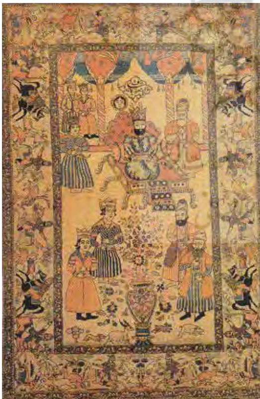
تصویر ۸- قالی تصویری، نقش خورشید خانم بر فراز تخت سلطنت، کاشان، دوره قاجار، ۱۳۰×۲۱۱ (مأخذ: زوله، ۱۳۹۰: ۱۱۸)