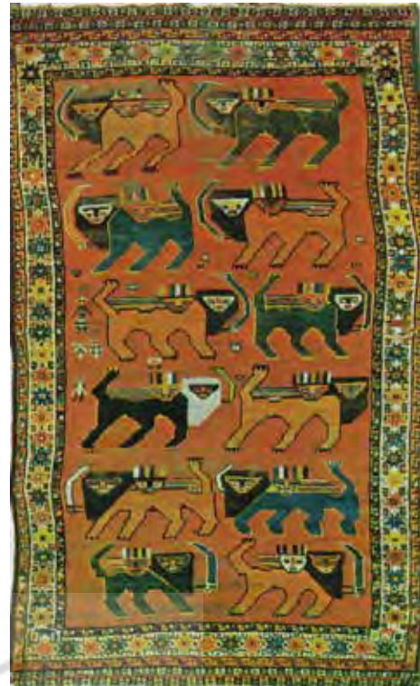
صویر ۱۱- فرش قشقایی، نقش خورشید خانم در پشت شیر، محل بافت فارس، ۲۹۴×۱۲۵ (مأخذ: تناولی ب، ۱۳۵۶: ۱۱۸)

عنصر قالب در این نگاره است در فرهنگ ایرانی به سبب ماهیت گرمابخش و نورانی مورد تقدس و احترام قرار گرفته و یادآور میترا و اهورامزدا پیش از اسلام و ذات احدیت مطلق در عصر اسلامی است. همچنین مادینگی که دیگر عنصر موجود در نگاره مورد بحث است، از دیرباز نمادی از باروری، پاکی و لطافت به شمار می آمده است. از این رو نگاره خورشید خانم به سبب تلفیق دو عنصر خورشید و مادینگی، حامل مفاهیم نمادین دو عنصر مذکور است و به طور کلی بر مفاهیمی چون الوهیت و ذات حق تعالی توأم با لطف و رحمتش دلالت دارد. بدین سبب خورشید خانم، نقش مایه‌ای ویژه در هنر قالی و دارای مفاهیم آیینی و فرهنگی است.