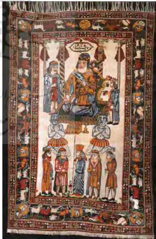
تصویر ۶- فرش هوشنگ شاه، نقش خورشید خانم در پس هوشنگ شاه، کرمان، ۱۲۸۳ ه. ش، ۱۳۵×۲۰۷ (مأخذ: بصام، ۱۳۸۴: ۱۹۲)