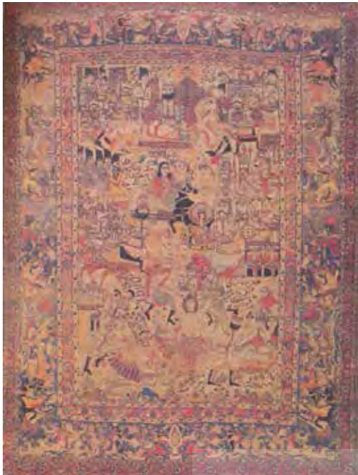
تصویر ۷- قالی تصویری، نقش خورشید خانم بر فراز تخت سلطنت، کاشان، دوره قاجار، ۲۶۰×۳۵۰