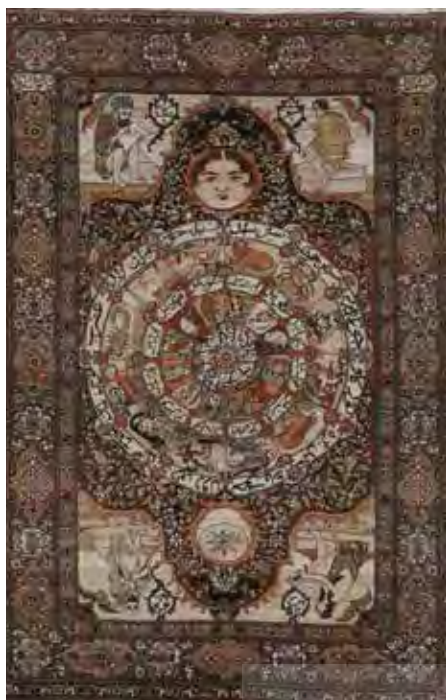
تصویر ۱۰- فرش قشقایی، نقش خورشید خانم و شیر، محل بافت فارس، ۲۴۵×۱۶۰ (مأخذ: تناولی ب، ۱۳۵۶: ۱۲۳)