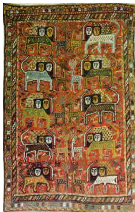
تصویر ۹- قالی منطقه البروج، نقش خورشید خانم بر فراز ایام سال، محل بافت اصفهان، ۱۱۸۰ ه. ش، ۲۱۸×۱۴۵

ارائه شده، برمی آید. از این رو کاربرد این نقش در قالی های عشایری امری بدیهی است که در نتیجه ارتباط نزدیک آنان با فصول مختلف سال، رخ داده است و از سویی دیگر کاربرد آیینی آن نیز مورد توجه است که در پی هویت ملی شکل گرفته و در قالی های بسیاری انعکاس یافته است.