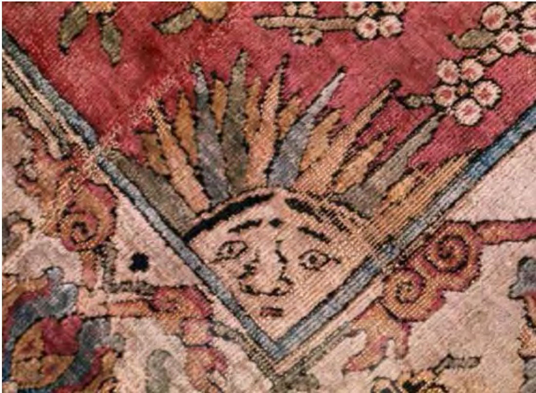
تصویر ۴- نقش مایه خورشید خانم در لچک فرش، بافت تبریز، (Sakhai, 2008, 154)

در موزه قالی ایران محافظت و نگهداری می‌شود. در این نمونه نقش مایه مورد بحث بر فراز ماه‌های گوناگون سال که بانام نجومی، شمسی و شمایل نگاریشان تصویر شده‌اند، قرار گرفته است و در مقابل این خورشید، ماه نیز قابل مشاهده است. تصاویر موجود در این تصویر در ابتدا بر مفاهیم نجومی و ایام سال اشاره دارد؛ اما با کمی تأمل قرار گرفتن خورشید بر فراز ایام گوناگون در حکم قدرتی واحد و آفریننده منطقه البروج است (بوس و فورد، ۱۳۸۸: ۱۱۷) و بر قرارگیری آن در مقابل ماه که اشارتی بر کثرت است (لاهیجی، ۱۳۷۱: ۷۲)، آن هم در فضایی مملو از گل‌ها و گیاهان تجریدی و ختایی متنوع، یادآور مفاهیم وحدت در کثرت در قالی و عرفان است و بدین سبب در حکم تذکره‌ای بر اقتدار و احدیت آفریدگار هستی است. نمونه‌های دیگر تجلی نگاره مذکور در قالی‌های شهری و یا روستایی در کنار نقش شیر است (تصویر ۱۳- ۱۰). این نقش که به شیر و خورشید هم معروف است، به گونه‌ای ترسیم می‌شود که شیر پیش‌تر و در پس آن نقش خورشید با دو چشم، ابروان پیوسته و یا منقطع و به صورت نیمه تصویر شده است. از نقش مذکور دو مفهوم کاملاً متمایز برداشت می‌شود که مفهوم نخست به سویه