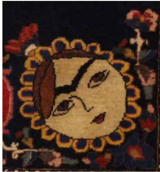
تصویر ۵- حضور نقش مایه خورشید خانم در بخش از متن فرش، بافت اصفهان، ۱۲۷۷ ه. ش، ۴۹×۱۳۶