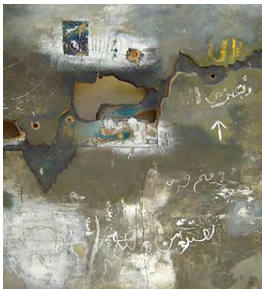
تصویر ۶. شاکر حسن السعید، فتح قریب، ۱۹۷۵، رنگ و روغن روی تخته. مأخذ: جبار جیاد، ۲۰۰۸: ۲۷۰.