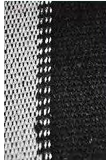
تصویر ۹. آ اثری از سالم الدباغ به نام حرکت در زمان، ۱۹۷۰، که از چادر بادیه‌نشینان که در سمت راست دیده می‌شود الهام گرفته شده است.

بحث : تداوم زیبایی‌شناختی در نقاشی مدرن عراق با آغاز دهه ۱۹۵۰ هنرمندان عراقی به منظور تکوین گفتمان هنر مدرن عراقی «جنبش بازگشت به ریشه‌ها» و الهام از میراث