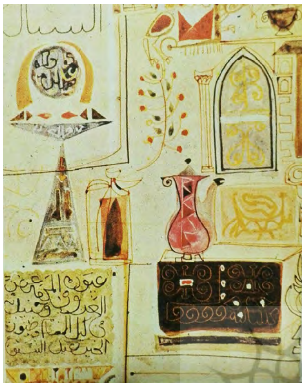
تصویر ۴. جواد سلیم، بغدادیات، ۱۹۵۵، رنگ و روغن روی بوم. مأخذ: السعید، ۱۹۹۱: ۱۲۹.