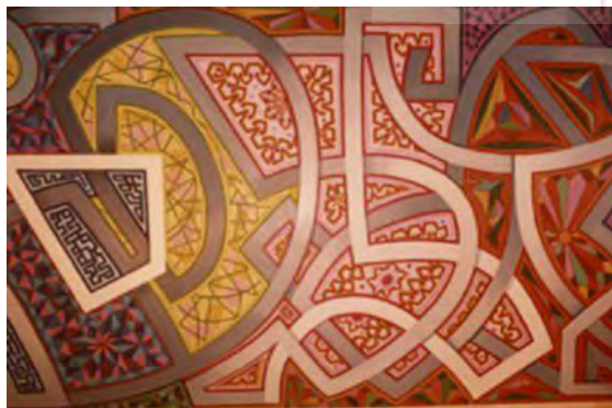
تصویر ۸. فرج عبو، خوشنویسی آبستره اسلامی، دهه ۱۹۸۰، رنگ و روغن روی بوم. مأخذ: www.farajabbo.com.

به کار می‌برد. وی با استفاده از تکنیک‌های ایجاد ترک و سوراخ (که احتمالاً جای گلوله است) سعی در کهنه‌سازی دیوارها کرده است. به گفته هنرمند او در این مجموعه از دیوارهای ساختمان‌های متروک محله‌های بغداد الهام گرفته است (تصویر ۶).