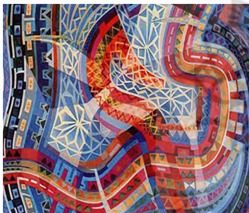
تصویر ۷. فرج عبو، تزیینات آبستره اسلامی، دهه ۱۹۷۰، رنگ روغن روی بوم.