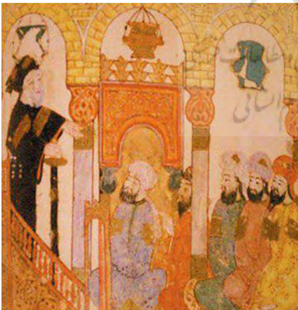
تصویر ۱. یحیی بن محمود واسطی، خطابه ابوزید در مسجد سمرقند (مقامات بیست و هشتم از مقامات حریری)، عراق - بغداد، ۱۲۳۷، ۵۹×۲۸۰ سانتی‌متر.

به طور کلی، نسخ مصوّر برجا مانده از مکتب بغداد دارای ویژگی‌های مشترکی چون فقدان رنگ پس‌زمینه و کادر، خطوط دورگیری تیره و ضخیم، شخصیت‌هایی با چهره‌های سامی، ترکیب‌بندی‌های خلوت و عناصر گیاهی مختصر بوده و تقارن و سادگی از دیگر ویژگی‌های کلی این نسخ هستند. بعد از حمله مغول در ۱۲۵۸، فرهنگ و هنر در عراق حدود شش قرن دچار رکود شد. این حمله تأثیر ویرانگر اجتماعی، اقتصادی و فرهنگی - هنری برای اعراب به همراه داشت و صدها هزار مسلمان قتل عام شدند. از این رو، بسیاری از هنرمندان کشته شده یا به کشورهای غربی یا همسایه فرار کردند. بین قرون ۱۴ تا ۱۶ منطقه کنونی عراق در دست ترکمنان آق قویونلو و قره قویونلو قرار داشت. از ۱۵۰۸ به