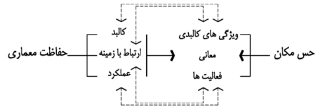
تصویر ۲. طرح واره ای برای نشان دادن اینکه حس مکان مقوله ای معنادار است و حفاظت معماری به دنبال احیای معنای فضا است، مأخذ: نگارندگان.

ث. یکی از راه‌های ارتباط فضاهای میراثی با زمینه اطراف، مشارکت آنها در تأمین فضاهای فعالیت و عملکردهای