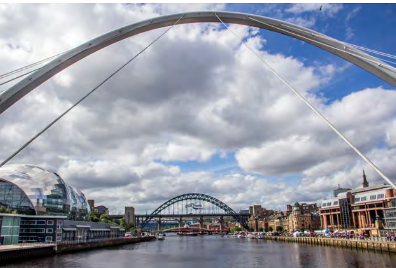
تصویر ۳: دسترسی پیاده و کمان توخالی پل میلیونوم یک نظرگاه شهری برای تماشای رودخانه، لبه شهری (سمت راست)، ساختمان سیچ (سمت چپ) و سایر پل‌ها ایجاد کرده است.