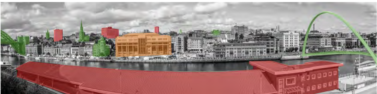
تصویر ۷: نشانه‌های بصری در تراز بالای دید به ناحیه کیسایدس، حدفاصل پل میلیونیم (سمت راست تصویر) و پل تاین (سمت چپ تصویر).

مسیر را نشان می‌دهد. به‌عنوان مثال، مقیاس و توده هتل «کاپترون» ۲۵ حکایت از نقش غالب آن بر فضای اطراف دارد (تصویر ۸) و یا شکل نمادین و مصالح به‌کاررفته در مرکز آموزش و اجرای موسیقی «سیج» ۲۶ ، این بنا را به‌عنوان یک نشانه متضاد با زمین شهری آن در جنوب رودخانه تاین نمایش می‌دهد (تصویر ۳). طرح‌های توسعه شهری جدید بایستی موقعیت و آینده این نشانه‌ها را در برنامه‌ریزی‌هایشان لحاظ کنند. هر بنای جدیدی که ساخته می‌شود می‌تواند یک لبه جدید شهری، تقاطع و یا یک نقطه میانی در مسیرهای حرکتی را به‌گونه‌ای تعریف کند که شهروندان را به پیاده‌روی و دوچرخه‌سواری از داخل شهر به سمت رودخانه هدایت و تشویق نماید. در همین راستا، شورای شهر نیوکاسل در سال ۲۰۱۰ یک طرح راهبردی ده ساله (۲۰۱۱-۲۰۲۲) جهت ارتقای مسیرهای دوچرخه‌سواری در سطح شهر را معرفی کرده است. این طرح دارای دوازده مسیر جداگانه است که همگی از بخش‌های مختلف شهر به مسیری به‌موازات رودخانه منتهی می‌شوند.