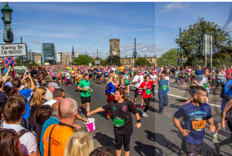
تصویر ۴: تجربه جمعی فضای پل تاین در هنگام مسابقه بزرگ دوی شمال (منظر موقت)، سمت گیتس هد. عکس: گوران عرفانی، ۱۳۹۵.

مفهوم مکان (در اینجا پل) به‌عنوان «ساختاری که از طریق تجربه حاصل می‌شود» (Tuan, 1975: 165) و همچنین پیوند مابین منظر پل و ساخت معنایی آن را تأیید می‌کند.