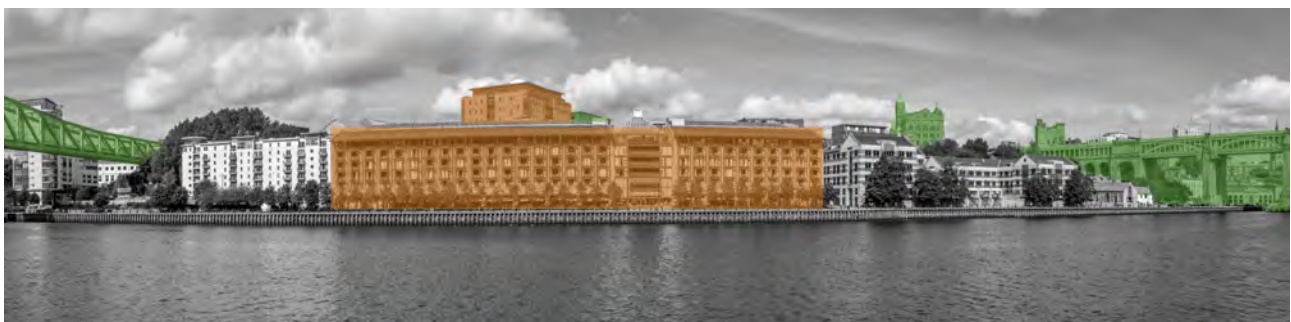
تصویر ۶: نشانه‌های بصری در تراز پایین دید، حدفاصل پل‌های لول (سمت راست تصویر) و پل مترو (سمت چپ تصویر).

این نوع نشانه‌ها، ساختارهای نمادینی هستند که امکان شناسایی یک شهر را فراهم می‌آورند. آن‌ها می‌توانند سازه‌ای باشند با اهمیت مهندسی یا بنایی که از ارزش تاریخی، فرهنگی و یا معماری برخوردار است. شهر