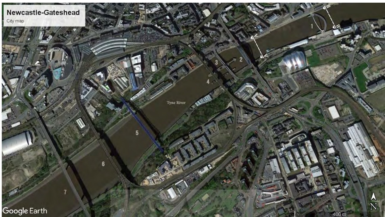
تصویر ۱: پل‌های روی رودخانه تاین به ترتیب از شرق به غرب: ۱. پل میلیونیوم (پیاده و دوچرخه)، ۲. پل تاین (سواره و پیاده)، ۳. پل سویینگ (سواره و پیاده)، ۴. پل‌هایلیول (سواره، پیاده و راه‌آهن)، ۵. پل کوپین الیزابت دوم (خطوط راه‌آهن و مترو)، ۶. پل کینگ ادوارد (راه‌آهن)، ۷. پل ردی هوف (سواره و پیاده).

شکل‌گیری بصری-فضایی یکی از چشمگیرترین مناظر شهری را در کشور انگلستان شکل داده است. این پل‌ها به ترتیب از شرق به غرب عبارت‌اند از: ۱. پل «میلیونیوم» ۴ (پیاده و دوچرخه)؛ ۲. پل «تاین» ۵ (سواره و پیاده)؛ ۳. پل «سویینگ» ۶ (سواره و پیاده)؛ ۴. پل «هایلیول» ۷ (سواره، پیاده و راه‌آهن)؛ ۵. پل «کوپین الیزابت دوم» ۸ (خطوط راه‌آهن و مترو)؛ ۶. پل «کینگ ادوارد» ۹ (راه‌آهن)؛ ۷. پل «ردی هوف» ۱۰ (سواره و پیاده)؛ (تصویر ۱).