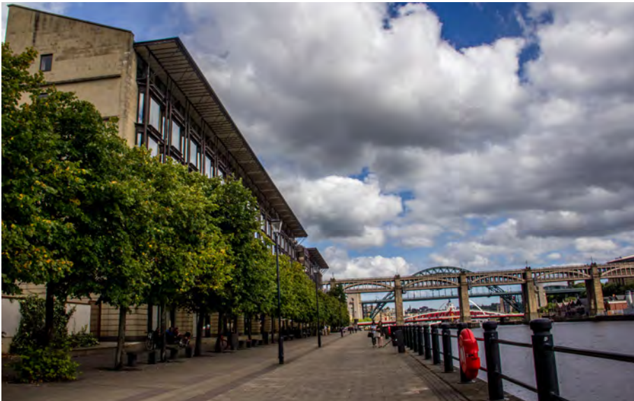
تصویر ۸: مقیاس و توده هتل کاپترون (در سمت چپ تصویر) حکایت از نقش غالب آن بر فضای اطراف دارد. عکس: گوران عرفانی، ۱۳۹۵.