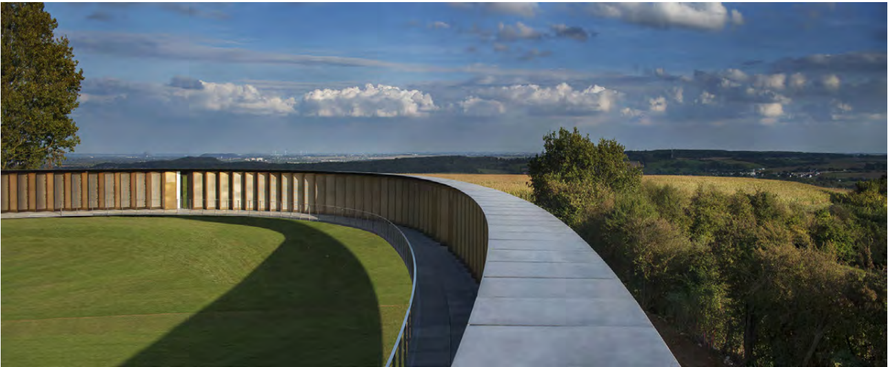
تصویر ۱۳ : حلقه یادمان جنگ جهانی اول در فرانسه، این اثر ترکیبی از فرم‌های انتزاعی و بیان استعاره‌ای است. مأخذ : http://www.archdaily.com/592142/the-ring-of-remembrance- agence-d-architecture-philippe-prost

به همین ترتیب می‌توان برای انتقال مفاهیم ارزشی به مخاطب از فرم‌های انتزاعی و الگوهای استعاره‌ای بهره جست. رنگ قرمز به‌تنهایی می‌تواند نماینده مفهوم شهادت باشد (رد پای قرمز بر روی زمین در یادمان جنگ بوسنی و هرزگوین). الزاماً نیازی نیست که یک مجسمه در ابعاد واقعی ساخته شود تا مرگ یک انسان را به تصویر بکشد. به‌ویژه آنکه ذائقه نسل امروز دگرگون شده و به پیچیدگی تمایل دارد. تصویر ۱۴ نشان می‌دهد که در طراحی یادمان‌ها با یک طیف مواجه هستیم که یک‌سوی آن استعاره و فرم‌های انتزاعی است و سوی دیگر آن واقع‌نمایی و معماری فرمال خواهد بود.