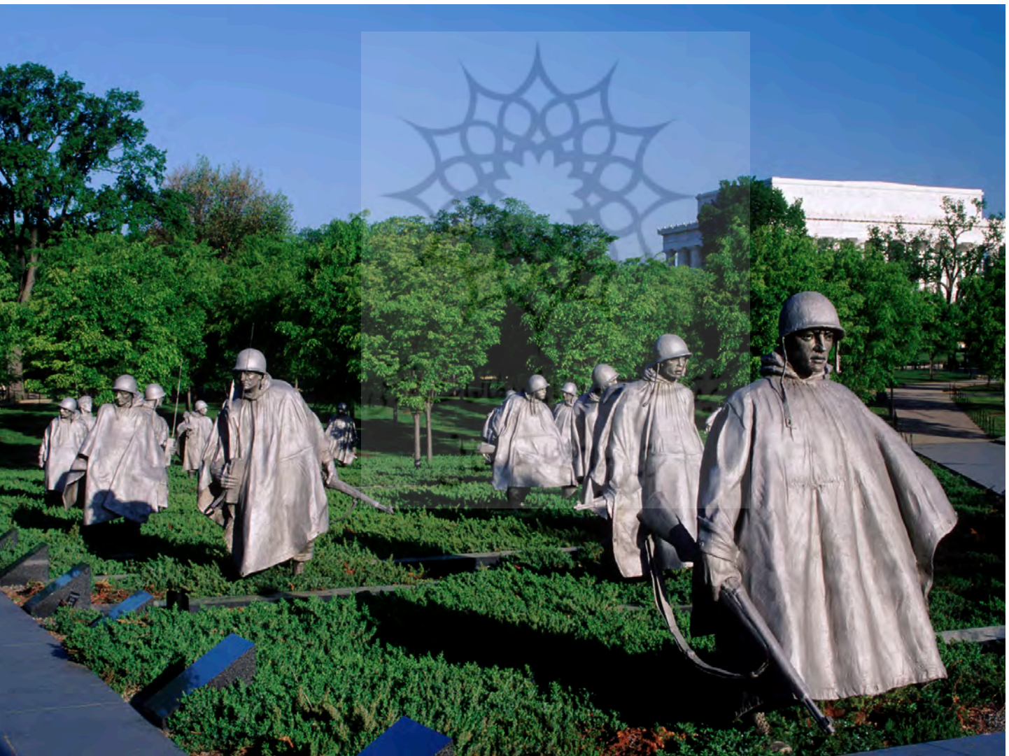
تصویر ۱۲: یادبود جانبازان کره‌ای. این اثر با بیان مستقیم و واقع‌گرایانه به سرعت با مخاطب ارتباط برقرار می‌کند اما به همین نسبت برای بازدیدکننده می‌تواند تکراری و کسالت‌بار باشد.

همچون «یادمان جنگ استرالیا» (تصویر ۲) می‌تواند الگوی مناسبی برای این دسته از یادمان‌ها باشد که از بیانی انتزاعی و سمبولیک بهره گرفته است. دسته دوم مکان‌هایی است که یادآور خاطرات جنگ است. در این حالت بازآفرینی صحنه‌های جنگ و کارکرد موزه‌ای آن‌ها مدنظر است. در این حالت تأکید بر واقع‌نمایی وجود دارد اما برای شاخص کردن مکان می‌توان از فرم‌های انتزاعی استفاده کرد (حلقه یادمان جنگ جهانی اول)؛ (تصویر ۱۳). اما دسته سوم به خاطرات، مفاهیم و ارزش‌های مرتبط با جنگ مربوط می‌شود. در این حالت یک امر ذهنی باید به قامت یک اثر کالبدی درآید. به‌عنوان نمونه