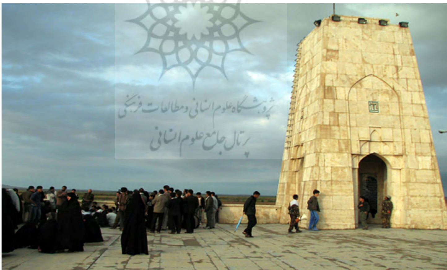
تصویر ۱۱: یادمان دهلاویه (شهید چمران).

یادمان شهید چمران نیز به قصد تأکید بر مکان وقوع یک اتفاق تأثیرگذار در طول جنگ احداث شده است. این اثر تداعی‌گر معماری مقبره‌ای است و از سوی دیگر فرم برجک‌های دیدبانی را به ذهن متبادر می‌کند. این یادمان به لحاظ معماری اثری با هویت محسوب می‌شود اما مخاطب به سختی می‌تواند ارتباط بصری و ذهنی با واقعه (اصابت خمپاره و شهادت دکتر چمران) برقرار کند.