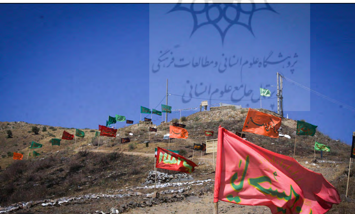
تصویر ۱۰: یادمان شهدای بوالحسن.