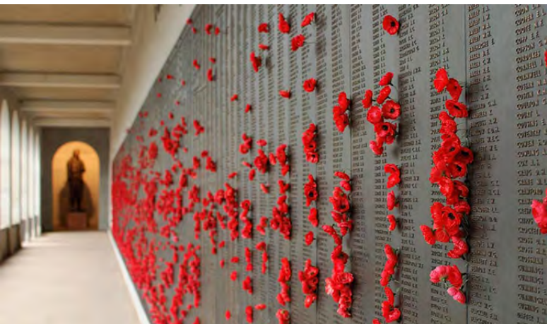
تصویر ۱: یادمان جنگ استرالیا. منظر بناهای یادمانی و شکل کالبدی آن می‌تواند نمادین و انتزاعی باشد.