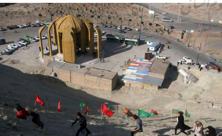
تصویر ۷: یادمان شهدای گمنام قم.