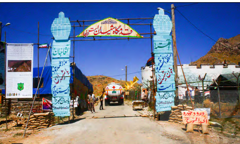
تصویر ۹: یادمان شهدای عملیات والفجر.

این یادمان به قصد حفظ و معرفی یکی از مکان‌های عملیاتی غرب ایران در طول هشت سال دفاع مقدس و شهدای این منطقه برپاشده است. مداخلات در این سایت حداقلی است و با نصب پرچم‌هایی در طول مسیر منتهی به تپه‌ای که محل عملیات بوده اقدام به تعریف فضا کرده‌اند. در قیاس با سایر یادمان‌ها، یادمان بوالحسن از حس فضایی بهتری برخوردار است هرچند تداعی‌کننده وقایع روی داده در مکان فوق نیست