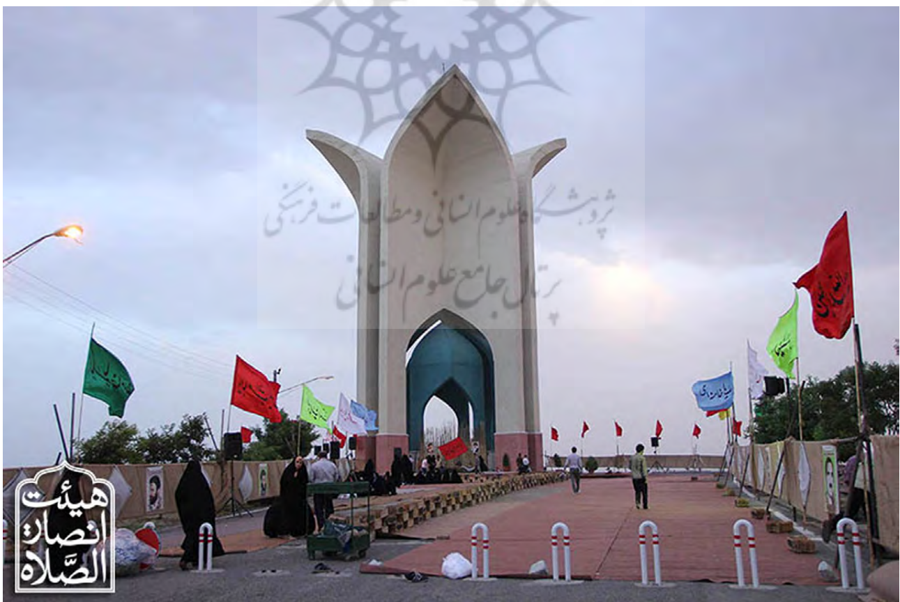
تصویر ۸: یادمان شهدای کشور در حومه شهر قزوین.

این بنا دارای دو چهارطاق بزرگ داخلی و خارجی جمعاً هشت طاق به یاد هشت سال دفاع مقدس و هشت شهید گمنام این مزار است. ارتفاع سازه بیرونی این بنا که بلندترین یادمان شهدای گمنام کشور است ۳۶ متر و ارتفاع سازه درونی ۱۵ متر از سطح زمین مجاور است که ترکیب این دو مقیاس با دو رویکرد برون‌گرا در مقیاس شهری و درون‌گرا در مقیاس انسانی و با استفاده از یک فرم واحد، ضمن سادگی در طرح دو مفهوم متضاد را القا می‌کند (تصویر ۸).