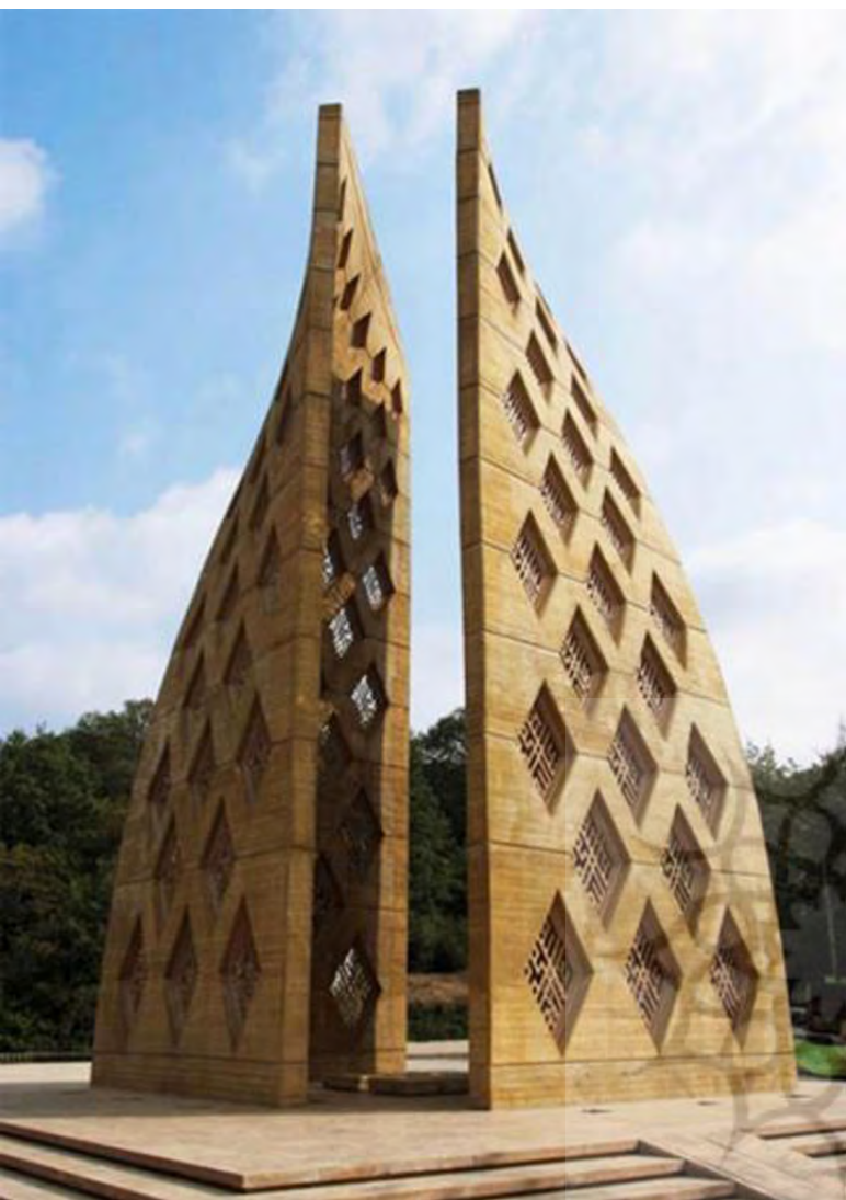
تصویر ۶: یادمان شهدای گمنام جنگل ناهارخوران.

یادمان شهدای گمنام قم در جوار کوه خضر نبی احداث شده است و بام قم محسوب می‌شود. مراحل ساخت آن از قبیل طراحی، تخریب سازه قدیمی و اجرای سازه یادمان توسط معاونت فنی مهندسی بنیاد حفظ آثار و نشر ارزش‌های دفاع مقدس انجام شده و سازه‌های نمادین محسوب می‌شود (تصویر ۷). این یادمان نیز با استفاده از بیانی فرمال و با استفاده از الگوهای رایج در معماری اسلامی که برای بیننده آشنا است،