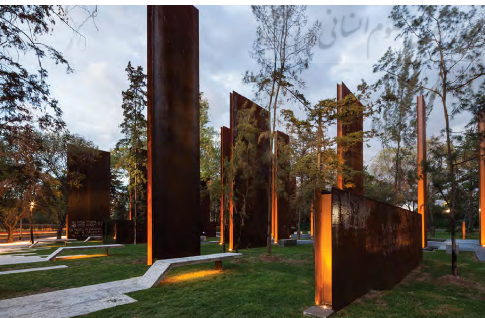
تصویر ۳: یادمان قربانیان مکزیکوسیتی. مفهوم ایستادگی و مقاومت در برابر خشونت را در منظر به نمایش درآورده است.