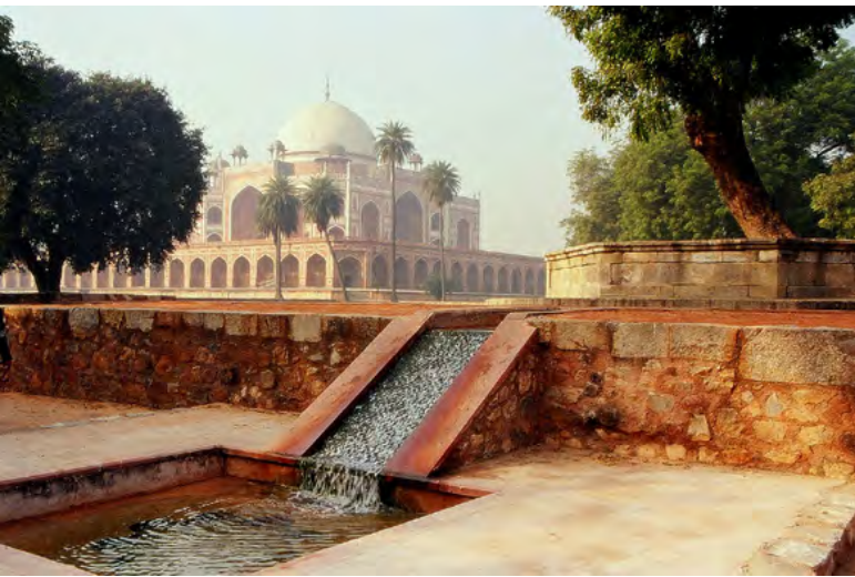
تصویر ۲: باغ مقبره همایون پس از بازسازی، جزئیات جوی آب.

به جزئیات باعث شد که او نه تنها برای هر قطعه از باغ سطحی مشخص کند بلکه برای اطمینان از این که آب باران جمع شده به سرعت از طریق چهار مجرای جمع‌آوری آب به سمت آب‌خوان‌ها هدایت شود، برای هر قطعه شیب جداگانه مشخص کرد. اکثر معمارانی که می‌شناختم برای کل باغ، یا در نهایت برای هر ربع از آن یک سطح تراز پیشنهاد داده و به همان بسنده می‌کردند؛ اما شهیر با حفظ حتی ۱۰ میلی‌متر اختلاف سطح، نه تنها اصالت پروژه را حفظ کرد بلکه به میزان قابل توجهی میزان کار مورد نیاز را کاهش داد.