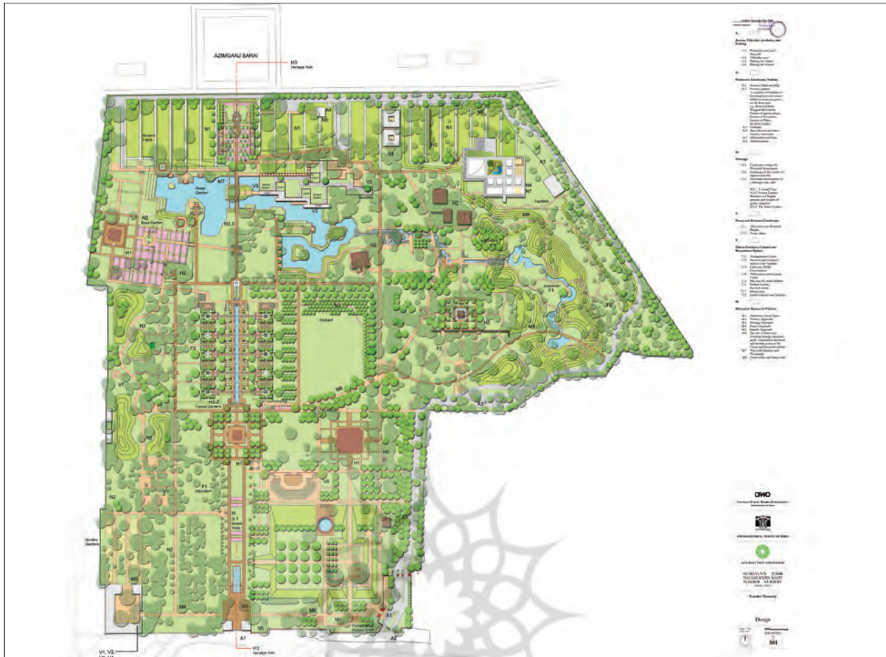
تصویر ۶: پلان محور مرکزی ساندر نرسری.

ایجاد یک فضای گسترده منظرین در مقیاس شهری بود که بر اساس فرهنگ هندی، بر تناسب، و نه جدایی بین طبیعت، باغ، سودمندی و حفاظت از محیط زیست استوار بود و فضاهایی برای تفریح عمومی با عملکردها و الگوهای رفتار شهری مختص دهلی فراهم می کرد (Shaheer Associates, 2008).