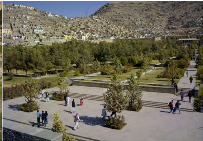
تصویر ۳: باغ بابر پس از بازسازی.

سایت، تراس‌ها سطح‌بندی شده؛ سطوح همواری برای باغ میوه و شیب ملایمی در بین این سطوح به وجود آمد. نهرهای روباز که برای آبیاری به کار می‌رفت با طرحی دقیق جایگزین شدند که در آن برای آبیاری هر تراس، لوله‌کشی زیرزمینی انجام گرفت و پس از آن آب در نهرهایی روباز جریان پیدا می‌کرد. به این ترتیب در حین حفاظت از آب، جلوه بصری که در اثر جریان آب به وجود می‌آمد باقی می‌ماند (تصویر ۵).