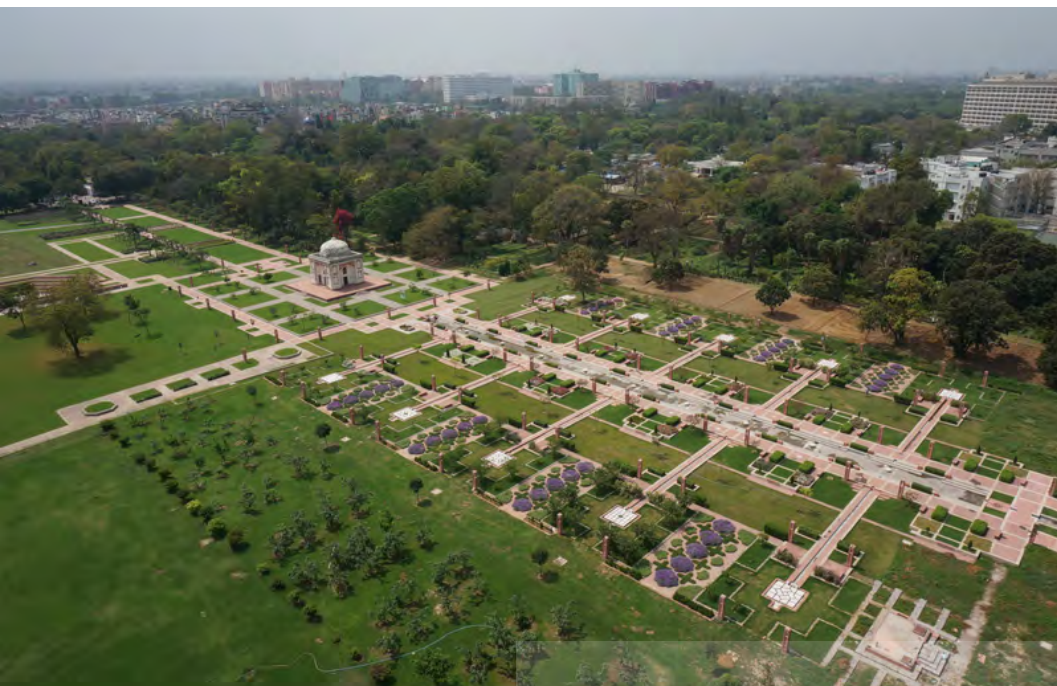
تصویر ۷: منظره هوایی محور مرکزی ساندر نرسری.

باغ از فراز سکوی برج ساندر، همچون فرش گسترده است» (Shaheer & Nanda, 2015); (تصویر ۷).