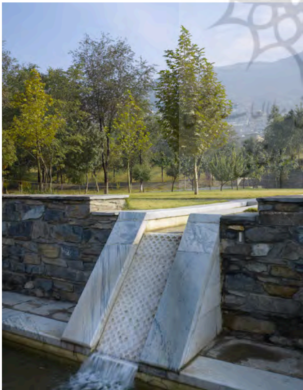
تصویر ۵: باغ بابر، جزئیات جوی آب پس از بازسازی.

نهال‌های موردنیاز را در تابستان علامت‌گذاری کرده و آن‌ها را در گل‌خانه‌های حومه شهر کاشتند؛ و پیش از بهار آن‌ها را به باغ بابر آورده و در شبکه‌های بزرگ کاشتند. از میان آن‌ها گیاهانی که سالم ماندند را همراه با خاک کاشتند بدون اینکه نیازی به جدا کردن نهال‌ها از خاک باشد. این روش، که با اصرار ما، توسط باغبان‌های افغانستان به کار گرفته شد، تقریباً ۱۰۰ درصد موفق بود و باعث تعجب و رضایت همه شد.