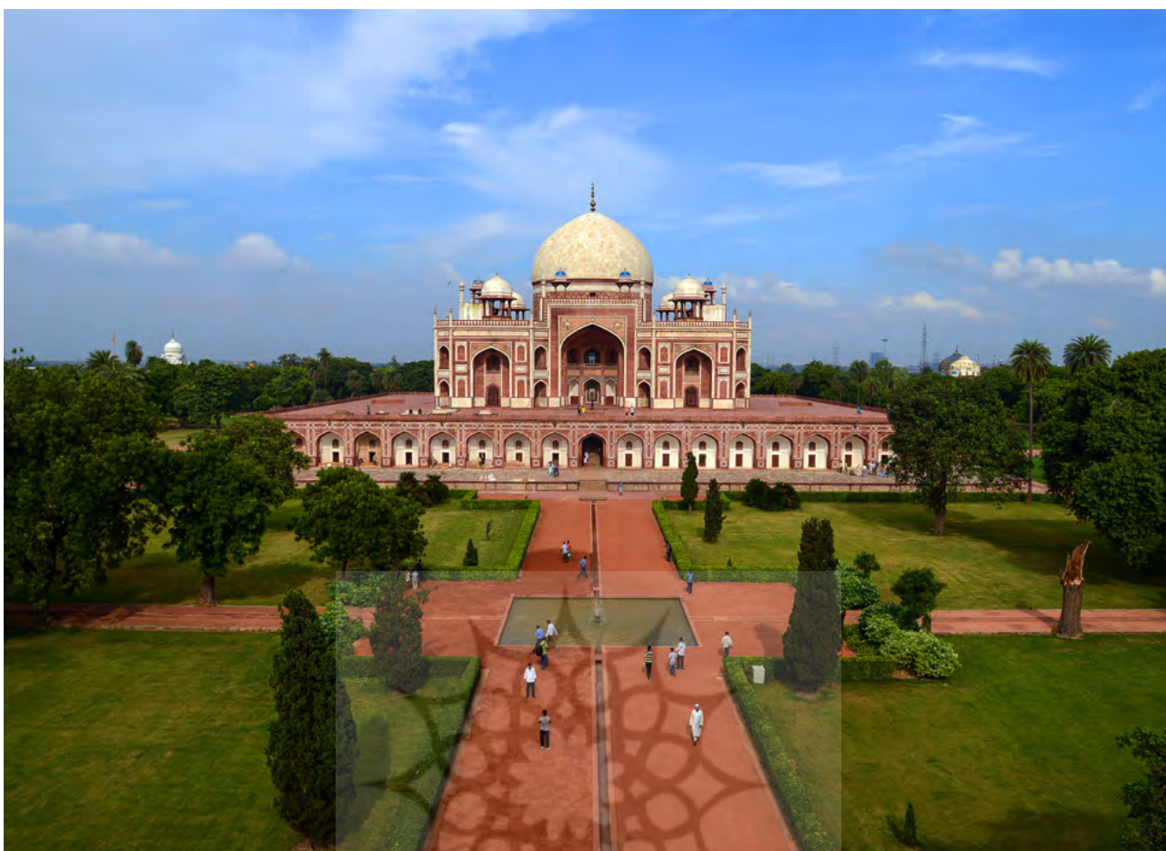
تصویر ۱: باغ مقبره همایون پس از بازسازی، محور اصلی.