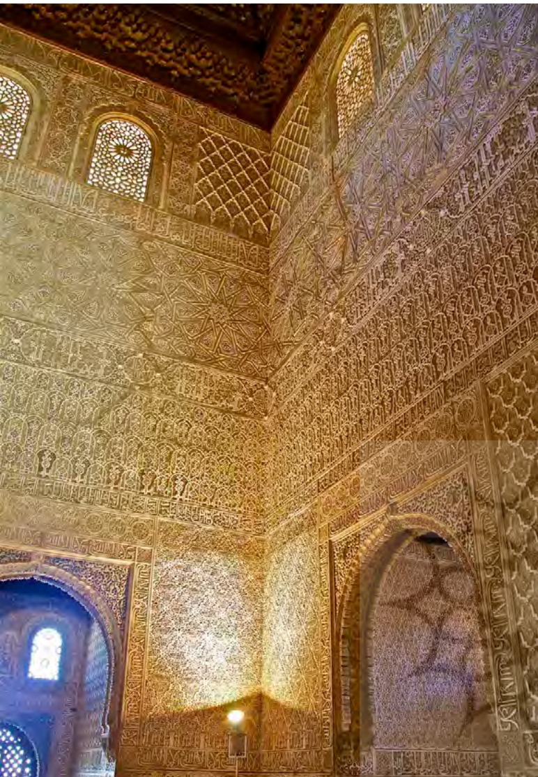
تصویر ۲: تالار کمارس

منتهی می‌شود؛ باغی که در آن یک آب‌نمای کشیده، انعکاسی از بناهای مجاورش را به تصویر می‌کشد. حیاط شیرها و مجموعه اتاق‌های مجاور آن، عمود به تالار کمارس بنا شده‌اند. این حیاط و بناهای آن به‌طور مستقل و با ورودی مجزا وجود داشته‌اند. حیاط شیرها برخلاف دیگر حیاط‌های الحمراء که در راستای محور شمالی-غربی هستند، در راستای محور شرقی-غربی جهت‌گیری شده‌است. محتمل‌ترین تفسیر برای این تفاوت جهت‌گیری را می‌توان تأخر زمانی در جانمایی و پیوند با ساختمان‌های موجود دانست.