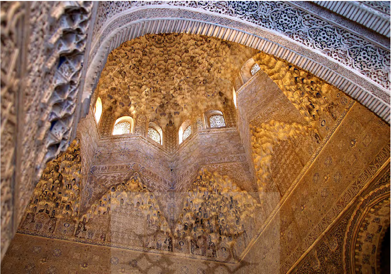
تصویر ۴: مقرنس کاری زیر گنبد تالار ابن سراج.

طبقات، سقف‌ها و طاق‌های مقرنس پوشیده شده بودند. ایروین مثالی از مدرسه‌ای در شهر «ساله» ۱۴ در مراکش ارائه می‌کند که در سال ۱۳۳۳ م. ساخته شده و به عقیده وی با حیاط شیرها قابل مقایسه است.