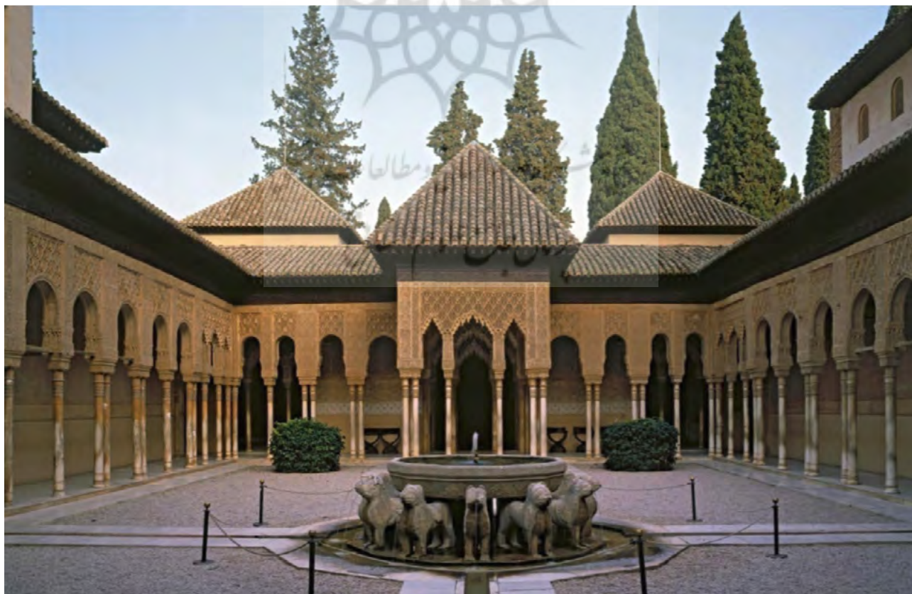
تصویر ۳: نمایی از حیاط شیرها.

حیاط شیرها بین دو تالار جای گرفته و بین باغ اندرونی و منظر بیرونی پیوستگی ایجاد می‌کند. حیاط و اتاق‌های مجاورش زنجیره‌ای پیوسته از فضاهای داخلی و خارجی را به وجود آورده که از تالار دو خواهر آغاز شده و به اتاقی مکعب شکل رو به باغ بیرونی ختم می‌گردد که «نظرگاه لیندارا ۱۸ » نام دارد و با دو پنجره به منظر بیرونی باز می‌شود. در قرن شانزدهم میلادی چارلز پنجم با ساختن دیوارهایی این دید گسترده به بیرون را محدود می‌کند. این نظرگاه شامل نقوش و گچ‌کاری‌های پیچیده‌ای است. چهار بخش حیاط که اکنون شن‌ریزی شده و فاقد پوشش گیاهی است، از حیث سادگی در تضاد با طاق و ایوان‌هایی است که به پیچیدگی تزئین شده‌اند. اگرچه که احتمالاً این اقدامی متأخر است؛ پیشتر، این فضا احتمالاً مشجر بوده و تزئینات گچی معمولاً رنگین بوده است. در طول بازسازی‌های قرن نوزدهم، سطح کف از دوران قرون وسطی در تراز هشتاد سانتی‌متر پایین‌تر از کف فعلی کشف شد. این اختلاف ارتفاع اشاره‌ای قوی به باغ‌های گود دارد که زمانی توسط افراد از بالا مشاهده می‌شده است. «آنتوان دلانگ» ۱۹ جهانگرد اوایل قرن شانزدهم از شش درخت نارنج