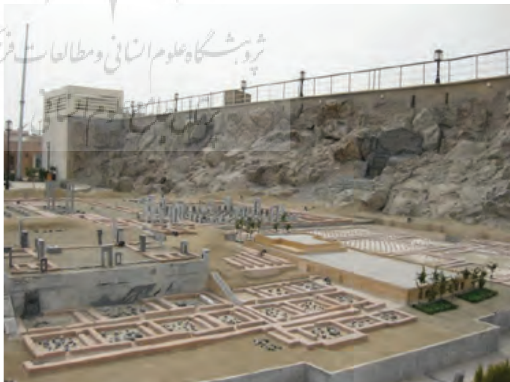
تصویر ۵ Pic5