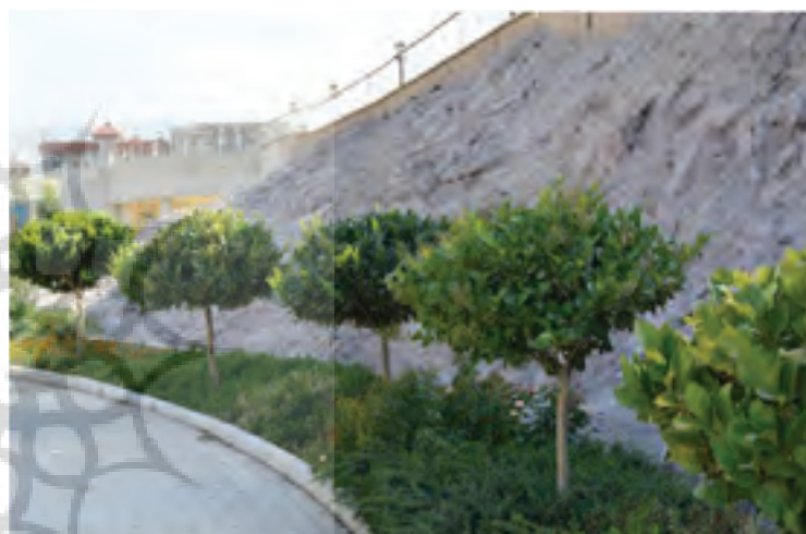
تصویر ۱ Pic1

Keywords | Museum, Exhibitive landscape, Place Attachment, Persian garden.