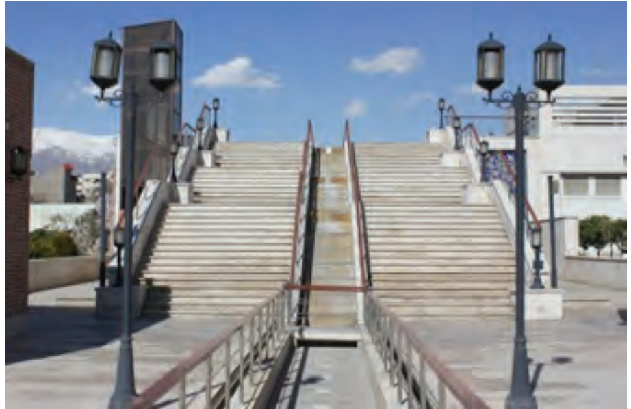
تصویر ۶ Pic6

Pic6: The stairs where leads to nowhere and follow no goal. Miniature garden-museum.