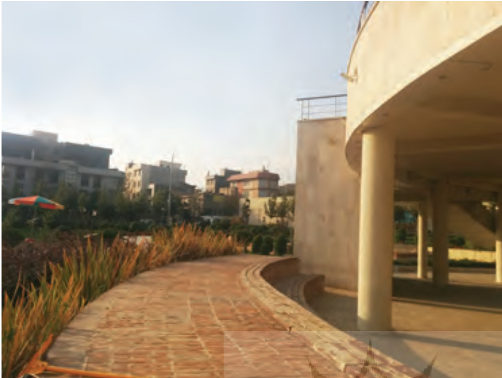
تصویر ۳: در مجموعه باغ موزه مینیاتور حتی در جایی که امکان استفاده از سایه سقف، برای نشستن وجود دارد محل نشستن، خارج از سایه ساخته شده است. این مسأله در روزهای گرم تابستان که آمار بازدیدکننده قابل ملاحظه است بیشتر به چشم می آید.

Pic3: Sitting spaces in the sun despite the existence of sun shade in miniature garden-museum. This is more obvious in summer days when the museum hosts maximum number of visitors.