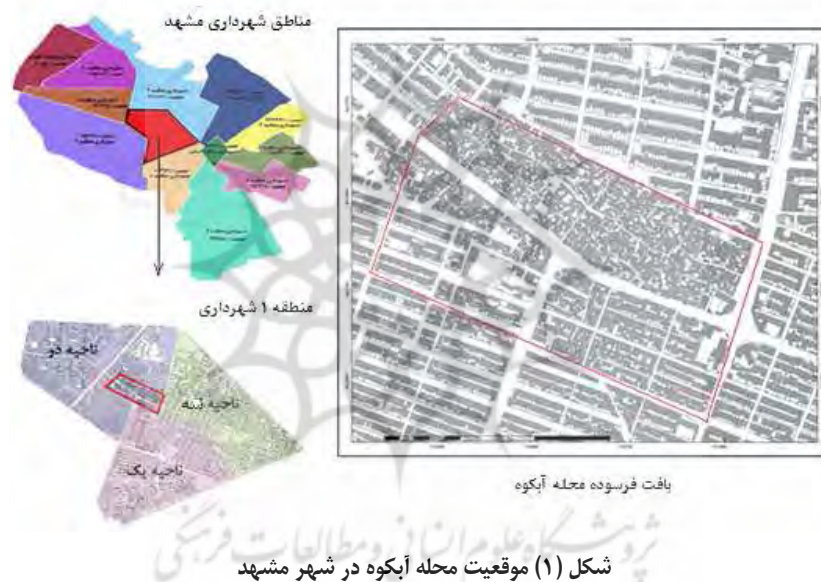
شکل (۱) موقعیت محله آبکوه در شهر مشهد

آبکوه پیش از توسعه فیزیکی شهر مشهد به شکل روستایی در فاصله ۶ کیلومتری غرب آن قرار داشته است. این روستا به دلیل سرعت زیاد توسعه فیزیکی کلانشهر مشهد طی دهه ۱۳۳۰، حاشیه شهر و از اواخر دهه ۱۳۴۰، داخل بافت شهری مشهد قرار گرفت. ساخت و سازهای روستایی و شکل‌گیری توسعه ثانویه بر اساس الگوهای اولیه و قدمت شکل‌گیری محله و همچنین عدم وجود مالکیت ساکنان به دلیل تصرف زمین‌های متعلق به آستان قدس و اوقاف، منجر به فرسوده محله آبکوه گردیده است (مقدم آریایی و همکاران، ۱۳۸۷).