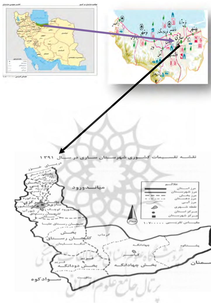
شکل ۱. موقعیت شهر ساری در شهرستان و استان مازندران

شهر به‌عنوان مرکز و پرجمعیت‌ترین شهر استان مازندران و همچنین مهم‌ترین قطب تجاری، اداری و تمرکز خدمات و امکانات دارای بیشترین وسایل نقلیه در استان است. محدوده مورد مطالعه در این تحقیق،