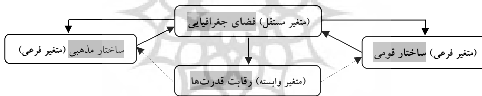
نمودار شماره ۱: متغیرهای تحقیق