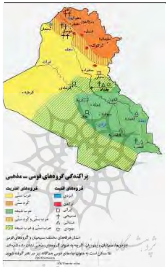
نقشه شماره ۱: پراکندگی گروه‌های قومی - مذهبی در عراق (گروه‌های اقلیت و اکثریت) ۱