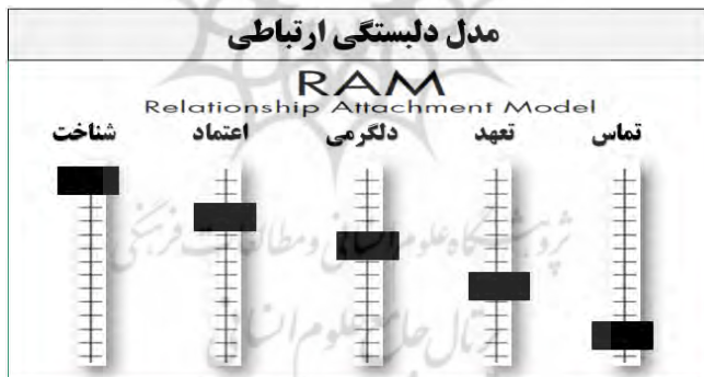
شکل ۱. مدل تصویری دل‌بستگی ارتباطی (RAM)

یکی از برنامه‌هایی که در زمینه آموزش پیش از ازدواج بکار بسته می‌شود، برنامه آگاهی و انتخاب‌های میان فردی پیش از ازدواج ۴ (PICK) است. این برنامه بر پایه مدل دل‌بستگی ارتباطی ۵ (RAM) به دست وان اپ (۲۰۰۶) به‌عنوان مدلی برای بررسی روابط نزدیک گسترش یافت. این مدل نظری شناساننده نگاره پیوندهای ارتباطی در یک رابطه است. همان‌طور که در شکل ۱ نشان داده شده است این برنامه دربرگیرنده پنج مؤلفه شناخت، اعتماد، دلگرمی، تعهد و تماس ۶ است. آمیخته‌ای از این پنج پیوند ارتباطی، نگاره‌ای از دریافت کلی در یک رابطه و اطلاعات معنی‌داری درباره احساس عشق، دل‌بستگی و نزدیکی در رابطه فراهم می‌کنند.