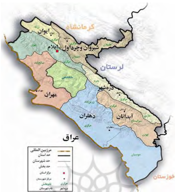
شکل شماره (۲). نقشه استان ایلام