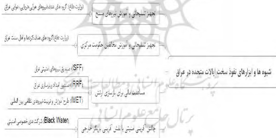
نمودار شماره ۲- شیوه‌ها و ابزارهای نفوذ سخت ایالات متحده در عراق

اقدامات سخت امریکا در عراق که پس از خروج نیروهای امریکایی از این کشور نیز ادامه داشته بیانگر وجود چهار شیوه کلی برای نفوذ در ساختار نظامی - امنیتی این کشور است. ایالات متحده امریکا برای پیشبرد اهداف خود در این بخش از ابزارهای متنوعی نیز بهره می‌گیرد. شیوه‌ها و ابزارهای مورد استفاده امریکا برای نفوذ نظامی - امنیتی در عراق در نمودار شماره دو مشخص می‌شود.