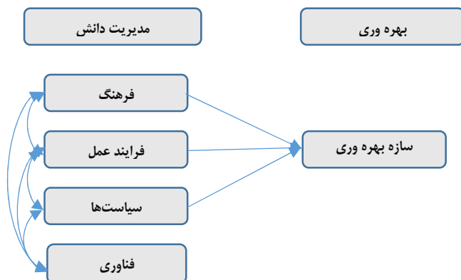
شکل شماره (2): مدل مفهومی پژوهش

ارزیابی و اعتبارسنجی مدل کلی تحقیق: در این بخش هدف اصلی پاسخگویی به این سوال است که آیا مدل پژوهش در مجموع برازش مناسبی دارد؟ برای پاسخ به این سوال می‌توان از معیارهای مختلفی از جمله مقدار X^2 یا c^2/df استفاده کرد. بر اساس نتایج حاصل از اجرای اولیه مدل شاخص‌های برازش (جدول 1) آرایه شده، مدل کلی تحقیق از برازش مناسبی برخوردار نیست لذا به منظور بهبود برازش مدل کلی تحقیق می‌بایست اصلاحاتی اعمال گردد.