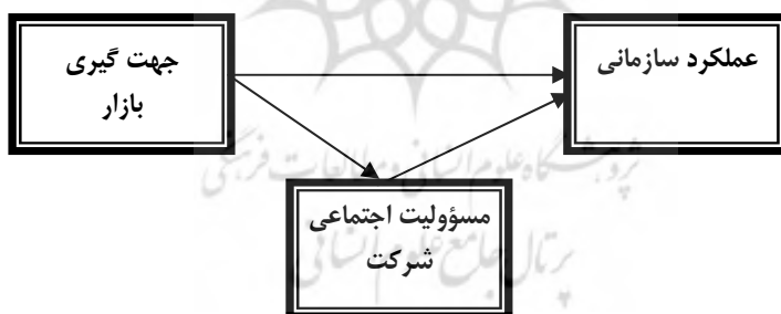
شکل 1، مدل پژوهش. (کیو ریلیانگ 4 ، 2009، 582-580)

چاحل و شارما 3 پژوهشی با عنوان کارکردهای مسؤولیت اجتماعی شرکت بر عملکرد بازاریابی انجام دادند. این پژوهش ابعاد کلیدی مسؤولیت اجتماعی شرکت را شامل فرهنگ سازمانی، منابع انسانی، محصولات و خدمات، فعالیت‌های توسعه اجتماعی و محیط قانونی در نظر گرفت. تأثیرات این فعالیت‌ها با سه پارامتر عملکرد بازاریابی شامل معیارهای اقتصادی، اجتماعی و روابط دارای همبستگی بودند. این پژوهش شش فرضیه داشت که مورد تأیید قرار گرفتند (چاحل و شارما، 2006، 25-21). در پژوهش حاضر محقق پس از بررسی پژوهش‌های صورت گرفته در موضوع مورد مطالعه، مدل کیو را کامل و جامع‌تر از سایر مدل‌ها یافت. به همین دلیل مدل کیو به عنوان مدل مرجع انتخاب گردید.