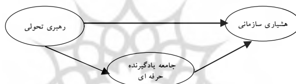
شکل ۱ الگوی مفروض پژوهش

بررسی تجربی نقش همزمان رهبری تحولی و جامعه یادگیرنده حرفه‌ای ۲ به‌عنوان عوامل اثرگذار بر ایجاد هشیاری سازمانی ۳ موضوعی است که کمتر به آن پرداخته شده است. پژوهشگران مقاله حاضر تلاش کرده‌اند تا میزان ارتباط رهبری تحولی با هشیاری سازمانی را در کنار نقش واسطه‌گری جامعه یادگیرنده حرفه‌ای در نظام آموزش عالی با رویکرد نظریه داده‌بنیاد در قالب الگوی نظری ذیل مطالعه نمایند.