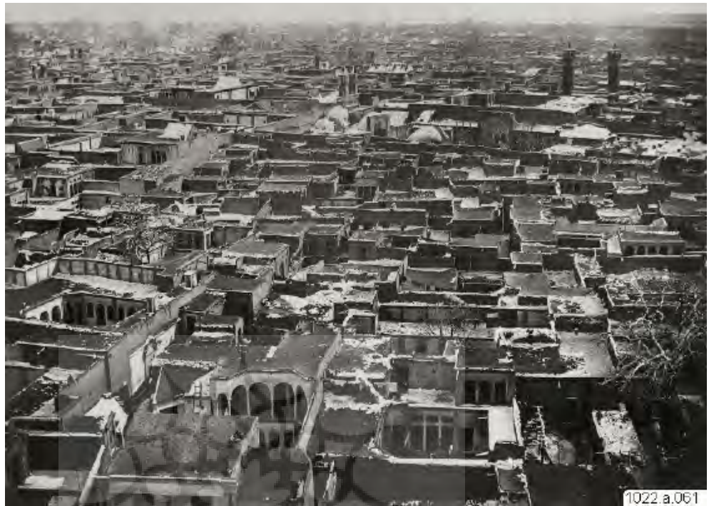
1022 a.061 تصویر ۳: تهران، دوره ناصری، خانه‌های شهری با حیاط میانی