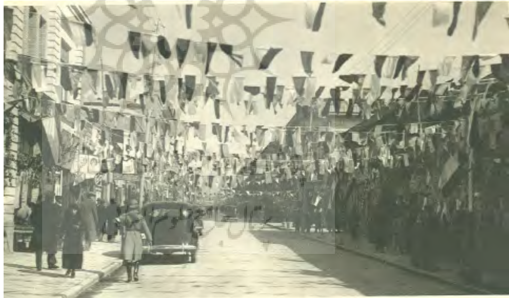
تصویر ۱۳: خیابان لاله‌زار، پهلوی اول

بنابراین ابتلای امروزی ما به ساخت‌وساز و خانه‌های بی‌کیفیت، ماحصل مدرنیسم نیست؛ در اصل آشنایی با تفکر غربی و تفوق آن بر ما هرچه که بود، اثرش را تا دوره پهلوی اول گذاشته بود و نتیجه‌اش همچون امروز نبود. شاید خانه از معدود جاهایی بود که مدرنیسم با همه سلطه‌خواهی‌اش نتوانست آن را چندان تغییر دهد. تنها تأثیر مدرنیسم بر خانه‌ها این بود که آسایش اهمیتی مضاف بر آرامش و حتی مرجع بر آن یافت. آنچه امروز در خانه‌های ما موج می‌زند، قلب معنای خانه است و نه حتی تنزل کیفی آن. دیگر هیچ نوع کیفیتی در خانه‌های امروزی حتی در گران‌ترین و مجلل‌ترین آن‌ها نمی‌توان سراغ گرفت؛ تنها می‌شود از کمیات سخن گفت.