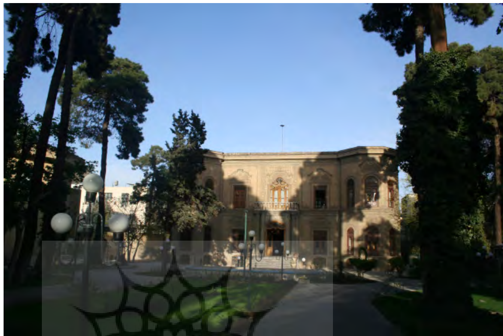
تصویر ۷: خانه قوام السلطنه، خیابان قوام السلطنه (سی تیر)، احمدشاهی

دو فصلنامه معماری ایرانی شماره ۱۰ - پاییز و زمستان ۹۵ ۲۳۵