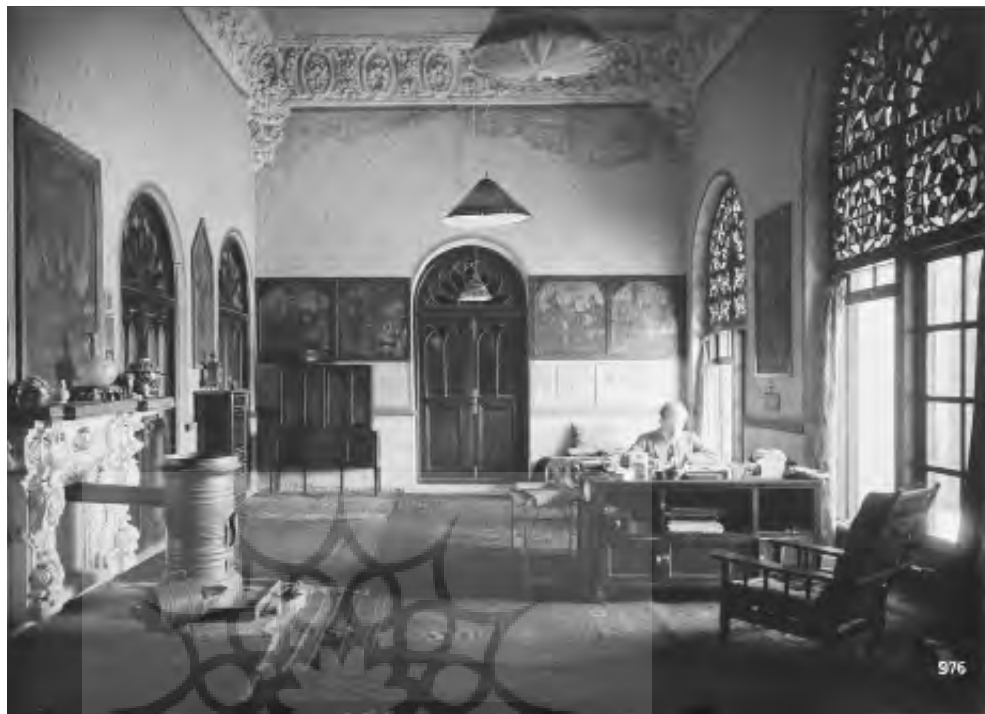
تصویر ۹: ارنست هرتسفلد در محل کارش، اوایل دوره پهلوی