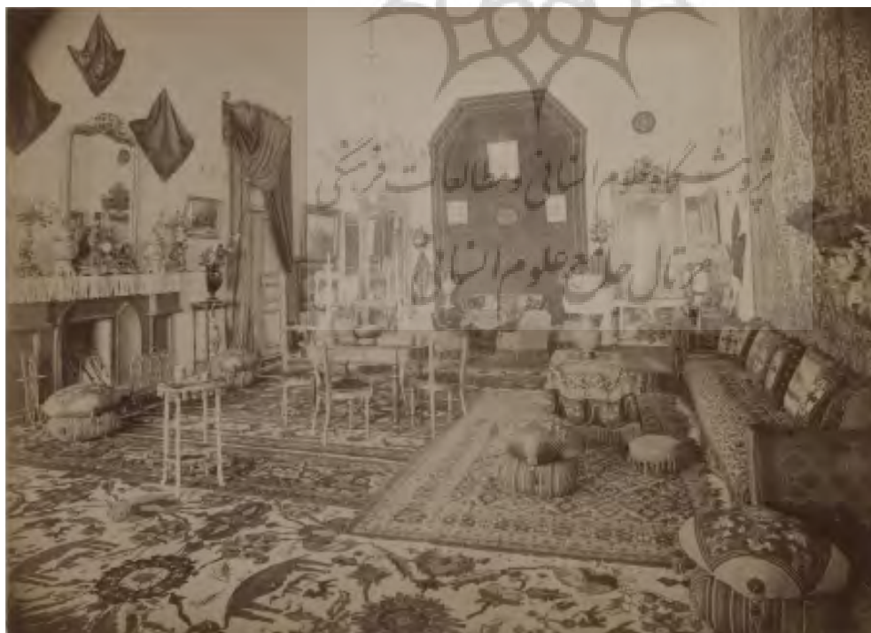
تصویر ۲: تالار خانه‌ای اعیانی، دوره مظفری