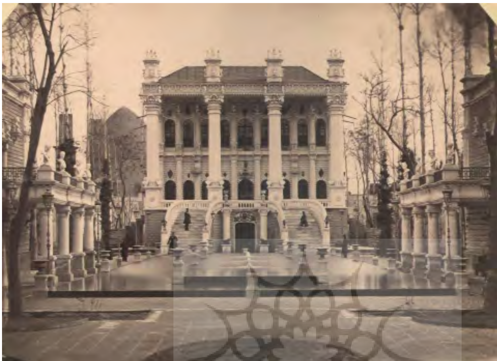
تصویر ۵: خانه شهری معیرالممالک، سنگلج، اواخر ناصری