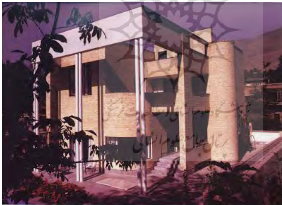
تصویر ۱۴: خانه افشار، خانه‌ای ویلایی از دوره پهلوی دوم

از اواخر دهه سی، به تدریج خانه‌ها به همان اصطلاح آشنای «خانه ویلایی» تغییر کرد. این عمارت‌ها دیگر کاملاً بی‌شبهت به حتی کوشک‌های شهری قبل از خود بود. حیاط دیگر حیاط میانی نبود و فضاهای خدماتی با فضای خانه تلفیق شده بود. حوض یا حذف شد و یا جای خود را به استخر داد و ایوان به تراس تبدیل شد. معنی باغچه و درخت به چمن و گل کاری تغییر کرد. حیاط نیز معنی پارکینگ به خود گرفت. در چند دهه اخیر که حتی از خانه‌های ویلایی نیز محروم شدیم و به آپارتمان‌ها آمدیم.