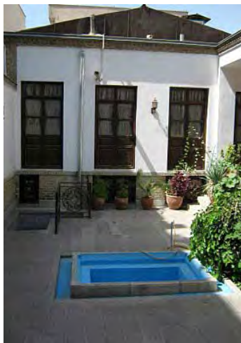
تصویر ۱۰: خانه ابوالحسن صبا؛ تصویری آشنا از خانه پهلوی اول