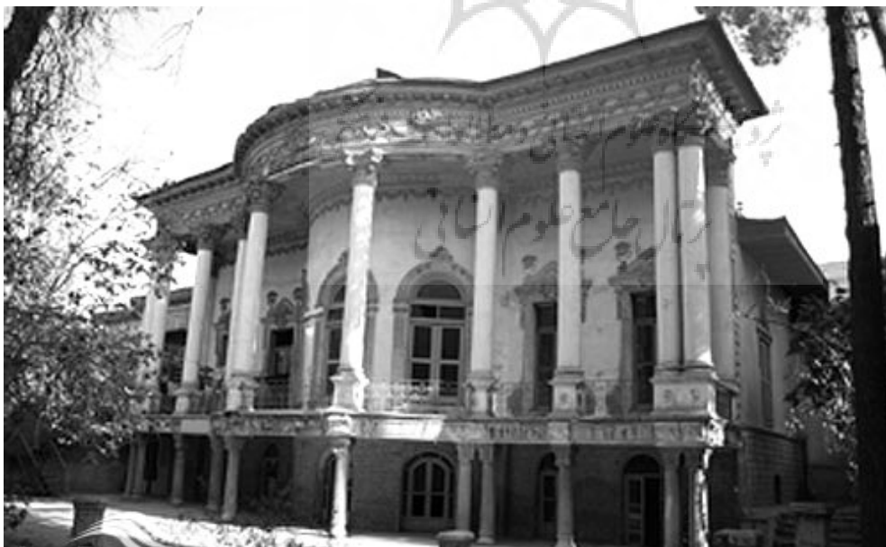
تصویر ۶: خانه مستوفی الممالک، چاله حصار، سنگلج، احمدشاهی