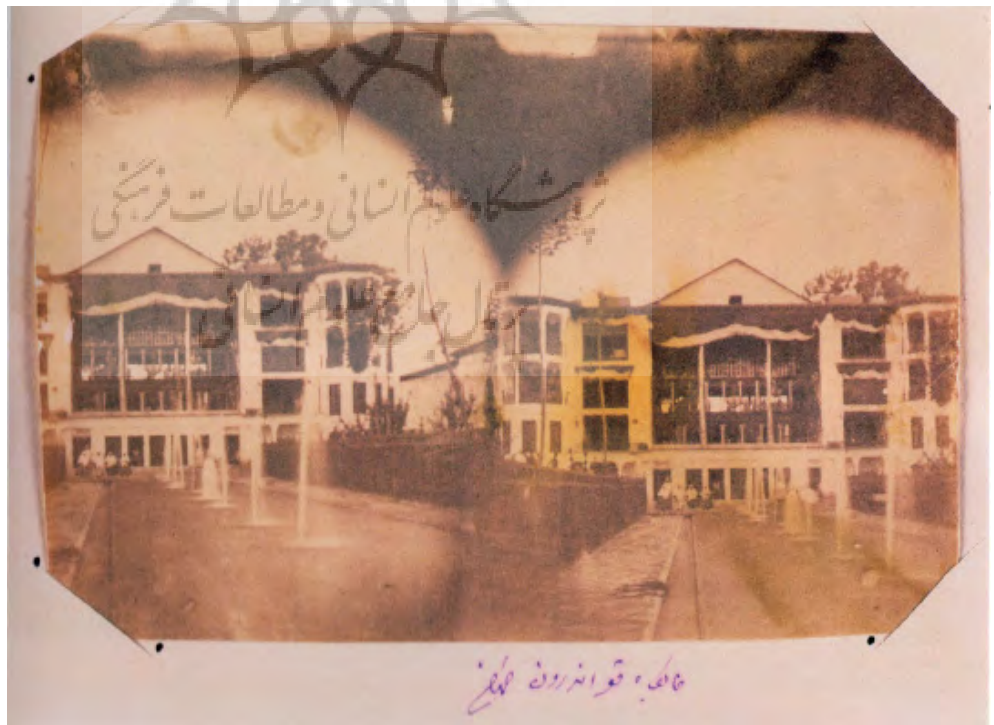
تصویر ۴: کوشک خواجه ناصرالدین شاه