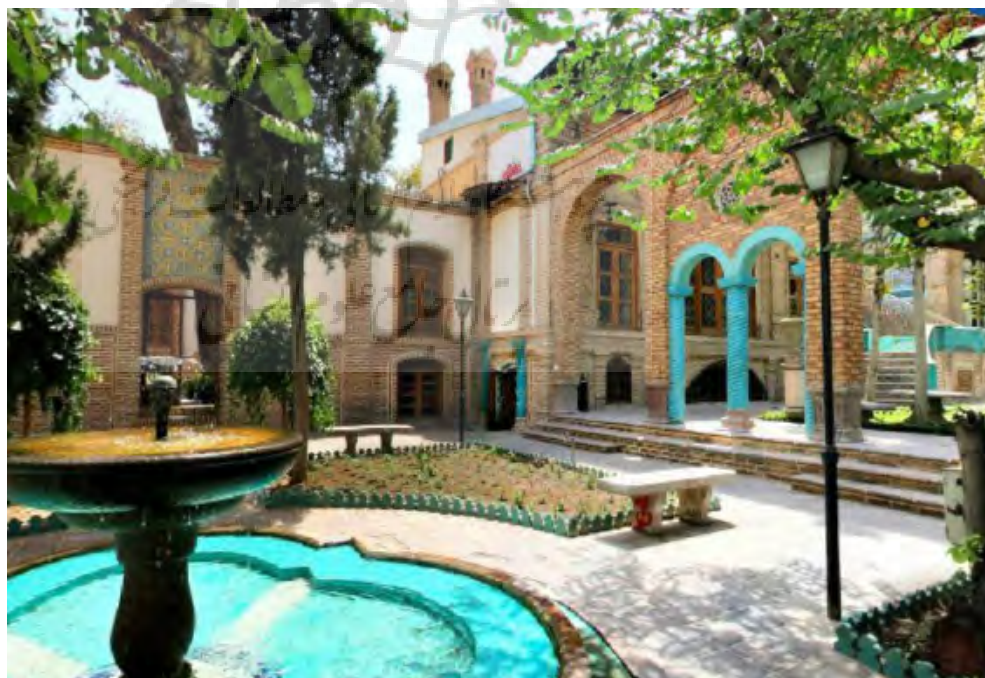
تصویر ۸: خانه و موزه مقدم، خانه‌ای دارای چند حیاط میانی، اواخر قاجار