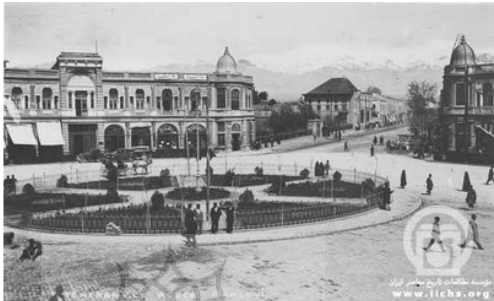
تصویر ۱۲: میدان حسن آباد تهران، پهلوی اول