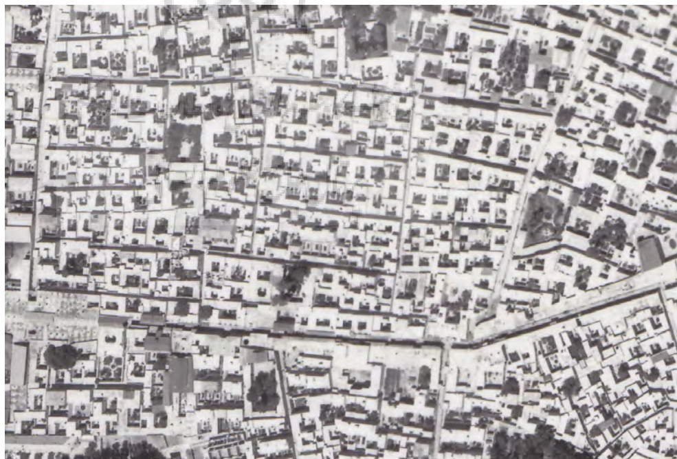
تصویر ۱۱: عکس هوایی تهران، سال ۱۳۳۵، هنوز اغلب خانه‌های شهری حیات مرکزی دارند.