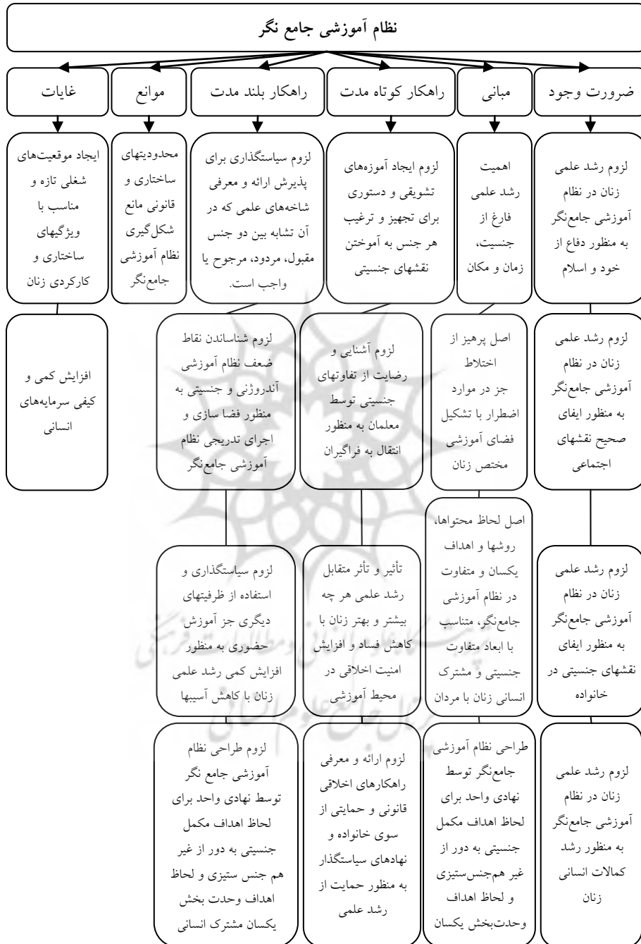
شکل ۱: نمودار تحلیل مضمون شبکه‌ای در نظام آموزشی جامع نگر (نمدنگرا)