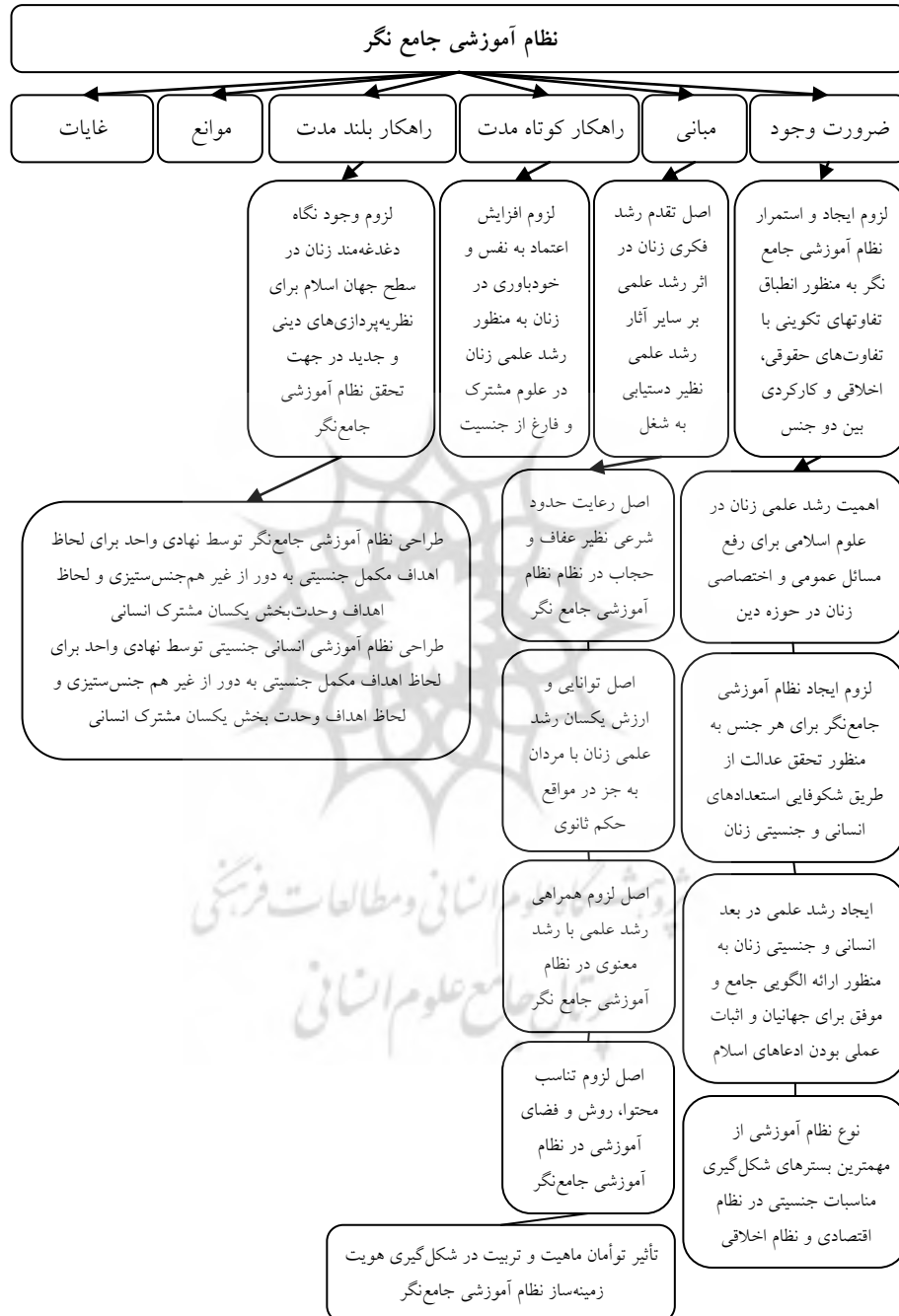
ادامه شکل ۱: نمودار تحلیل مضمون شبکه‌ای در نظام آموزشی جامع نگر (تمدنگرا)