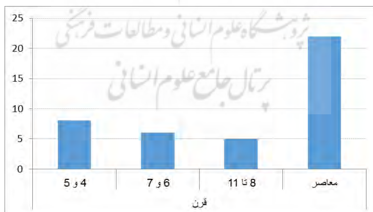
نمودار ۲. سیر تاریخی فراوانی کارکرد اختناق سکوت

بخشی از زمینه‌های اجتماعی ناشی از جبر و اختناق سبب شده است که سکوت برگرفته از متون ادبی، علاوه بر نقش‌های ذکر شده، کارکردی اعتراضی انتقادی بیابد. در این وضع، سکوت بیشتر به دلیل جبرهای مختلف و وضع و موقعیت اجتماعی به وقوع می‌پیوندد. این مضمون به‌خصوص در ادبیات معاصر و دوران مبارزه، عمدتاً علیه نظام شاهنشاهی یافت می‌شود. شاید دلیل توجه روزافزون به این نوع کارکرد سکوت را بتوان به عوامل مؤثر در تحولات عصر مشروطه و دوران پس از آن نسبت داد. عواملی مانند رفت‌وآمد نخبگان سیاسی و فکری جامعه ایران به کشورهای غربی، ورود دستگاه چاپ، گسترش روزنامه‌نگاری و در پی آن نیازهای جامعه انقلابی به بسط و گسترش فعالیت‌های فکری و سیاسی در مقابله با استبداد شاهی منجر به دگرگونی و تحول نثر و درونمایه شعر فارسی شد (یوسفی، ۱۳۷۵). به‌نظر می‌رسد همراه با مطرح شدن مضامینی نو همچون آزادی، وطن، قانون‌گرایی، ظلم‌ستیزی و توجه به ملت، کارکرد سکوت به‌میزان زیادی شکل معترضانانه و انتقادی به وضع موجود ناشی از نابسامانی‌های اجتماعی به خود گرفته است. نمودار ۲ سیر تاریخی توجه به و تأکید بر کارکرد اختناق سکوت مستخرج از متون ادبی را از قرن چهارم تا زمان معاصر به تصویر کشیده است. دلیل این امر را شاید بتوان در «بُعد قدرت» هافستد جست‌وجو کرد که افراد هم‌زمان با تحولات عصر مشروطه و بالارفتن آگاهی، کمتر حاضر به پذیرفتن نابرابری‌ها در عرصه اجتماعی و تجمع قدرت در دست عده‌ای خاص شده‌اند.