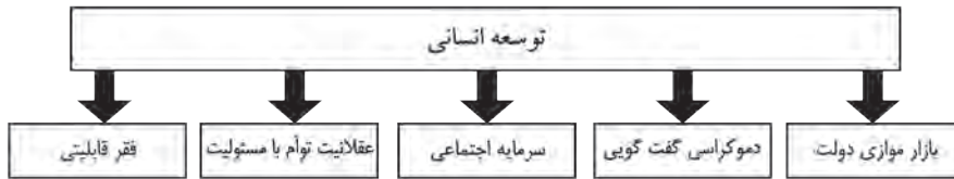
شکل ۳. توسعه انسانی

از نظر سن، فقرا باید در ارتباط با توانمندی تعریف کرد و آن را جلوه‌ای از سلب توانمندی دانست، نه صرف کمبود درآمد. درآمد یکی از عوامل مؤثر بر فقر است، ولی فقرا نباید در کمبود درآمد خلاصه نمود. او در ارتباط با فقر از مفهوم «قابلیت» بهره می‌گیرد و معتقد است در «فقر قابلیت» ۱ اولاً این محرومیت از توانمندی است که فی نفسه مهم است، نه محرومیت از درآمد. ثانیاً عوامل مهم دیگری در محرومیت از توانمندی نقش دارند که دیدگاه درآمدی قادر به درک آنها نیست. به عبارت دیگر، تأثیر درآمد بر توانمندی نه مطلق، بلکه مشروط است و از عوامل متنوعی نظیر جنسیت و نژاد تأثیر می‌پذیرد (سن، ۱۳۸۹: ۲۰۶).