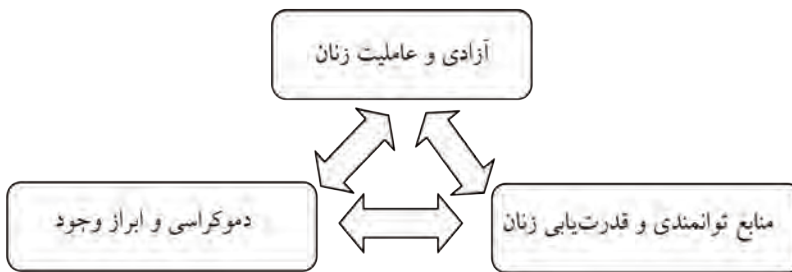
شکل ۴. توانمندسازی زنان