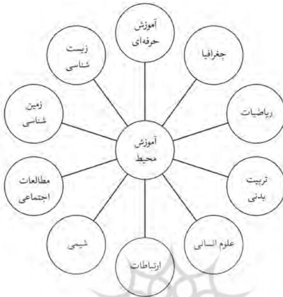
شکل ۱. سازماندهی میان رشته‌ای آموزش محیط زیست

امروزه بین رشته‌ای بودن آموزش محیط زیست به عنوان یک الگوی موفق پذیرفته شده است هر چند نکاتی قابل تامل در این مورد وجود دارد.