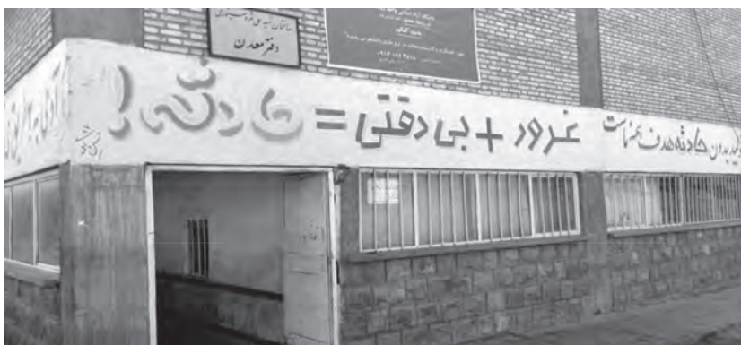
تصویر شماره ۳. دفتر معدن پابدانا (واقع در منطقه کوهناب کرمان)

ایدئولوژی سرزنش قربانی به مدیریت اقتدارگرایانه محیط کار مشروعیت می بخشد و تناقص بین خواست مدیران در جهت انباشت سرمایه از طریق تولید بیشتر و رابطه آن با وضعیت نامناسب ایمنی در محیط کار را پنهان می سازد. این امر از طریق تأکید بر تبیین های فردی حادثه به جای توجه به فشار حاصل از افزایش تولید و طراحی یک جانبه فرایند کار از سوی مدیران صورت می پذیرد.