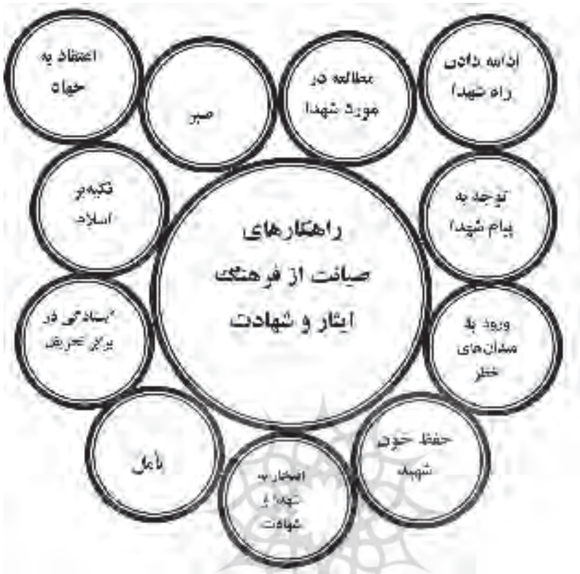
ترسیم شکل راهکارهای صیانت از فرهنگ ایثار و شهادت