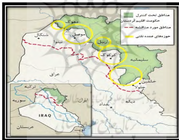
نقشه شماره 2: حوزه‌های عمده منابع نفت

By Mary Kate Cannistra, The Washington Post - November 23, 2008