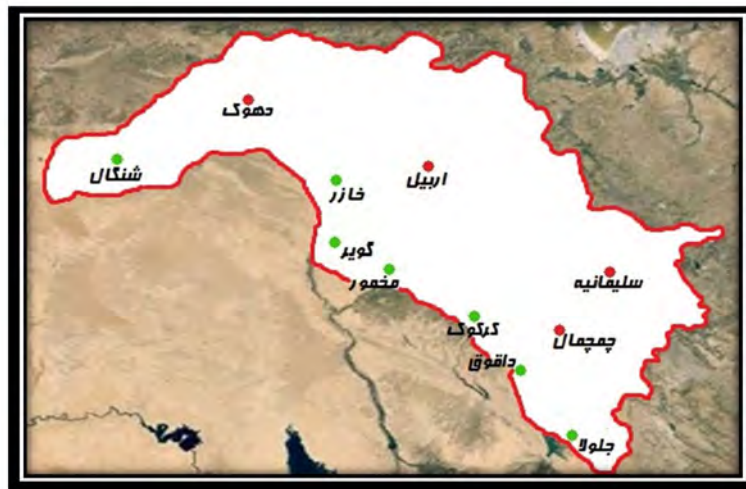
نقشه شماره 1: مناطق مورد مناقشه

(محورهای شنگال، خازر، گویر، مخمور، کرکوک، داقوق، جلولا)