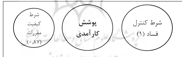
نمودار ۲- پوشش شروط

شکل زیر نیز نشان‌دهنده میزان پوشش و اهمیت این دو شرط است.