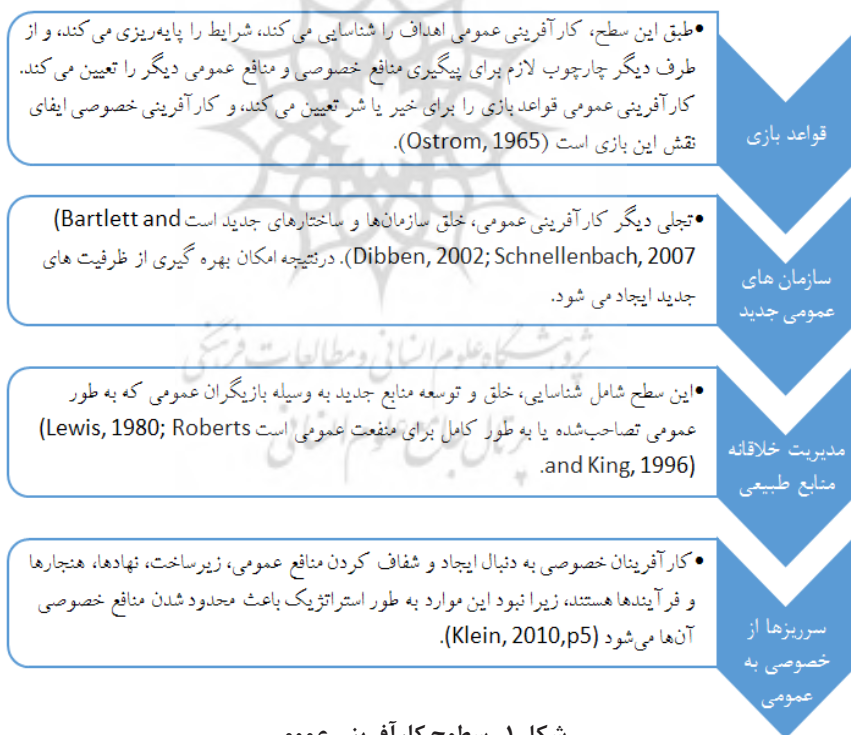
شکل ۱- سطوح کارآفرینی عمومی

اندیشمندان در خصوص کارآفرینی عمومی، تعاریف مختلفی را ارائه داده‌اند اما در مجموع می‌توان آن را به این صورت جمع‌بندی کرد: «فرآیند خلق ارزش برای شهروندان از طریق گرد هم آوردن ترکیباتی از منابع دولتی یا خصوصی برای بهره‌برداری از فرصت‌های اجتماعی تمرکز این کارآفرینی عمومی بر خدمات‌رسانی کارآمدتر به شهروندان است (الوانی و همکاران، ۱۳۸۹، ص ۸)». علاوه بر این تعریف ارائه شده، می‌توان کارآفرینی عمومی ۱ را در چهار سطح دسته‌بندی کرد که در قالب شکل زیر به آن پرداخته شده است.