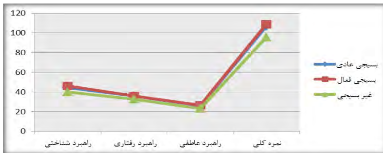
نمودار ۱. میانگین راهبردهای مذهبی در گروه‌های مورد مطالعه (بسیجی عادی، بسیجی فعال و غیربسیجی)

وضعیت توصیفی گروه‌های مورد مطالعه (بسیجی عادی، بسیجی فعال و غیربسیجی) در ابعاد راهبردهای مذهبی را در نمودار زیر مشاهده می‌کنید.