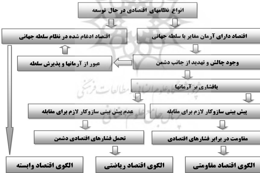
نمودار ۱- وضعیتهای سه‌گانه برای نظامهای اقتصادی کشورهای در حال توسعه

اقتصاد ریاضتی، سرنوشت محتوم آن نظام اقتصادی است که با وجود داشتن آرمان مغایر با نظام سلطه، نتوانسته باشد ساز و کار لازم را برای پاسخ به چالشها فراهم سازد. این همان سرنوشت بدی است که باید از آن اجتناب کرد؛ زیرا در شرایط اقتصاد ریاضتی، هزینه‌های زیادی به مردم و جامعه تحمیل می‌شود که ممکن است مسائل امنیتی مهمی را نیز بر اثر پایین آمدن سطح رفاه عمومی برای کشور ایجاد کند؛ لذا اقتصاد مقاومتی، الگویی برای احتراز از دو سرنوشت نامطلوب، یعنی «وابستگی اقتصادی» و «اقتصاد ریاضتی» است.